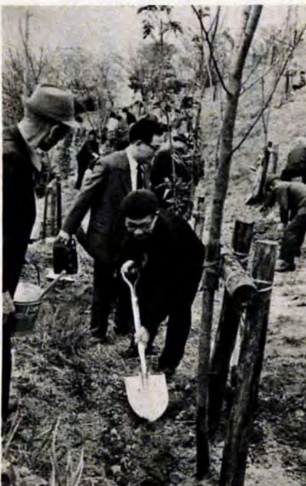
3月29日若松区高塔山公園で第24回植樹祭が行なわれ、緑化運動の優良団体の表彰式に続いて全員で桜や椿などを植樹しました。

市は、昭和45年度から、市民と一体となって都市緑化事業を進めてきました。公園や街路、学校、その他公共施設に八万本を植樹、地域団体など三百八十三団体の自主活動による花園造成運動も着々と成果を上げ、現在まで、約五十万本の花苗を無料で配付しました。 この計画では、従来行なわれてきた緑化運動をさらに計画的に推進するため、苗木を栽培する直営苗圃を新設し、昭和51年度までに三十五万本を植樹します。