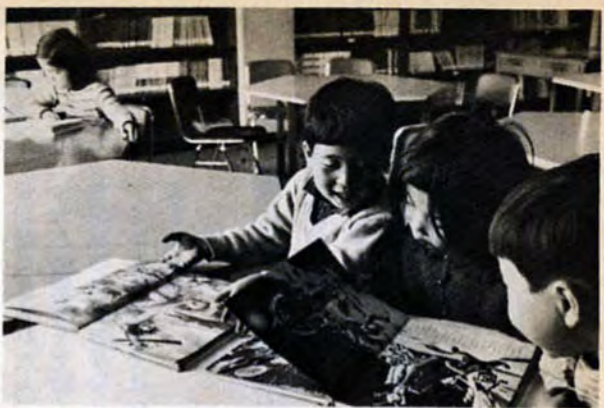
毎月第2日曜日はクラブ活動の日——科学、図書、焼物、模型工作、無線、星の会などがある