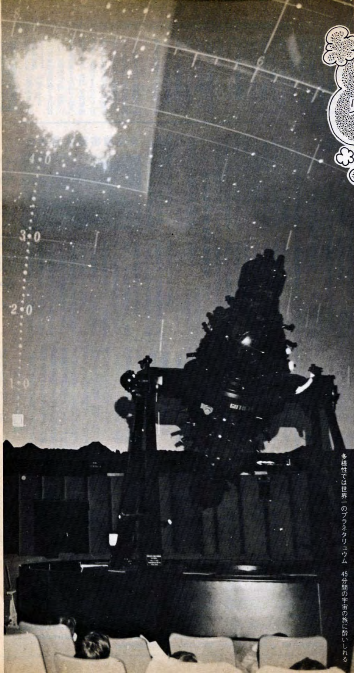
多様性では世界一のプラネタリアウム 45分間の宇宙の旅に酔いしれる

八幡区桃園公園内にある児童文化センターと宇宙科学館。ここは、ちびっ子たちの宇宙への夢や科学する心などがあふれた「ちびっ子の世界」だ。