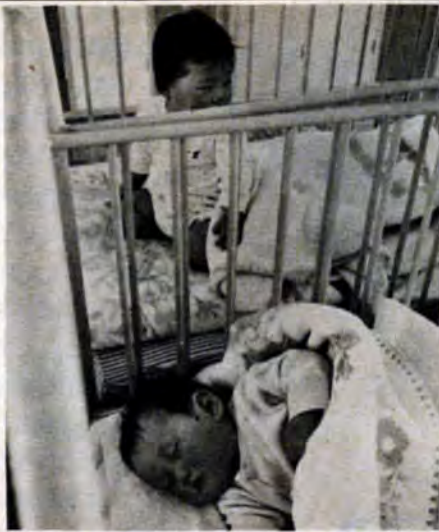
三歳未満児の医療費支給制度

★ 市は、ことし7月1日から「乳幼児医療費支給制度」を実施するため5月7日から対象者の申請受け付けを始めます。 ★ この制度は、三歳未満児（昭和45年7月2日以降に生まれた人）に対し医療費を支給。乳幼児の健康の保持とすこやかな成長をはかるものです。