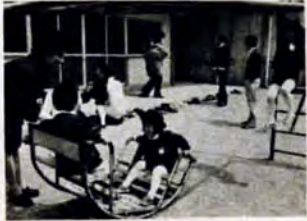
新幼稚園児を迎えた小倉区霧ヶ丘幼稚園

【テレビ】 ◎ちょっと失礼=TNC・10チャンネル、毎週火曜日22時56分～23時 ▷4月17日市営住宅2万戸達成 ▷4月24日おばあちゃん入門学級 ▷5月1日建築技能士をめざして ◎市政ニュース=FBS・UHF 35チャンネル、毎週月～木曜日10時56分～59分 ▷4月16・18日おばあちゃん大学、おばあちゃん入門学級 ▷4月17・19日消費生活センター1日教室 ▷4月23・25日武蔵小次郎まつり ▷4月24・26日市立折尾東部総合食料品センター開く。 【ラジオ】 ◎おはよう北九州=RKB・1200KC、毎週土曜日10時50分～11時 ▷4月21日点字歌集を出版した河原さん ▷4月28日十周年シリーズ「財政」 ▷5月5日学童保育クラブをたずねて ◎市からのおしらせ=RKB・1200KC、毎週月～金曜日10時58分から30秒。 ◎市政だより=FM福岡80MHz 毎週水・土曜日9時55分～10時。