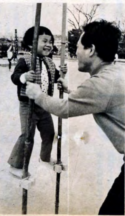
日曜日の広場には親子づれも多い ここではみんな仲良しだ