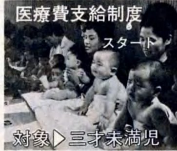
医療費支給制度 スタート 対象▷三才未満児

白石市場前 ▽27日 中井四丁目新日鉄化学錦ヶ丘集会所 ▽5月2日 市営朝日ヶ丘団地集会所