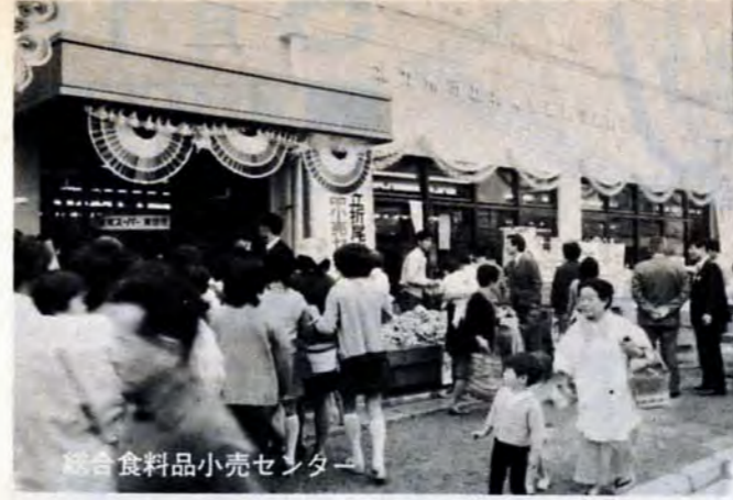
総合食料品小売センター

折尾東部総合食料品小売センターは、八幡区本城鞍ヶ谷にある市・県営住宅など約千四百戸の団地中央部に3月31日完成、4月20日に店開きました。このセンターは地区のみなさんが安定した価格で、安心して買物ができるようにと建てられたものです。 売場面積三百五十三平方メートルの中に、鮮魚、野菜、精肉、鶏肉、そう菜・天ぷら、漬物・つくだ煮、生花、化粧品などの店とスーパーマーケットがあります。 市職員が常駐して、商品の安全性、品質表示の適正化、適正な価格・量目などについて指導するなど消費者保護をはかります。