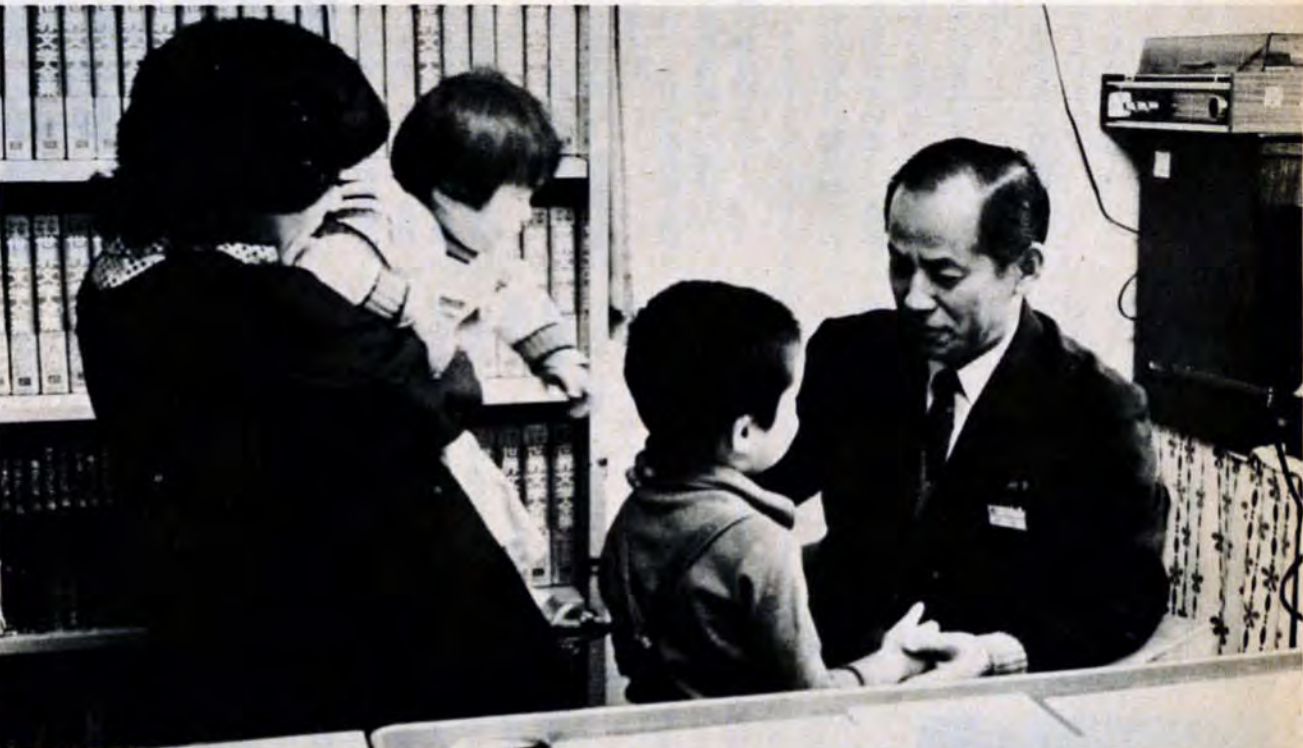
職員が行き届いた指導によって、子供たちも、明かるい表情を取りもどす

強いからだ・豊かな心—ファミリースポーツのつどい 明るい健康な家庭をつくるため家族をろうて、汗を流しからせをきたえましょう。 〔内容〕▽第一回5月20日、バスハイキング▽第二回6月24日 艇スポーツ大会▽第三回7月29日、デイキャンプ大会▽第四回8月26日、オリエンテーリング大会▽第五回9月16日、お別れレクリエーション大会。 〔対象〕市内居住の家族五十組(両親と子ども二人、小学四年生、中学一年生)。第一回、五回まで全部参加できる家族。 〔会費〕一家庭千円。 〔申込み〕往復ハガキに住所、家族の氏名、年齢、職業、学校名、学年、電話番号を書いて、5月10日までに市教育委員会体育課(808小倉区城内1-1、582局2395)へ。希望者が多い場合は抽選します。