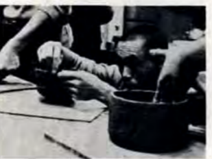
小倉区足立公民館・陶芸教室。

消費生活センターに、近ごろ次のような苦情がでてきています。 会社帰り、車に乗った若い青年に呼びとめられた。その青年のいうには、「会社の商品を配達しての帰りだが、商品の背広が残っているので安く売りたい。一着二万円のところ、二着一万円にする」とのこと。