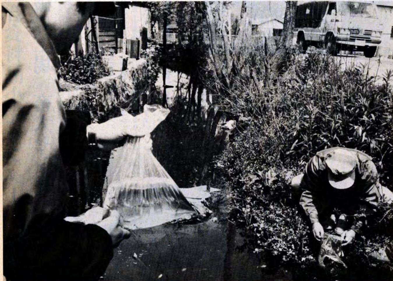
4月18日 北九州空港前で