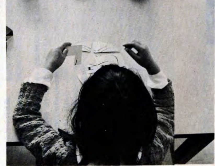
いま何を考えているのか? 性格は? など子供の心理を知ることは指導のきめ手になる

希望者は、5月5日から20日まで、実習費千円を持参のうえ、城野公民館(小倉区富士見町一丁目、801局7866)へお申込みを。 ●老人大学受講生 ▼第一老人大学 対象は六十歳以上の門司・小倉区民百二十人。 △期間 6月～11月の毎週水曜・木曜日 9時30分～12時30分。 △会場 小倉中央公民館(808小倉区城内3-1、871局2713) ▼第二老人大学 対象は六十歳以上の若松・八幡・戸畑区民二百人。 △期間 5月～11月の第一・第三月曜日 9時30分～12時30分。 △会場 八幡区羽衣町一丁目、652局3817。▽西部班 穴生公民館(808八幡区鷹ノ巣三丁目、641局6026)。 いずれも受講は無料。教材費は自己負担。申込みなどかわしくはそれぞれの会場へお問合わせを。