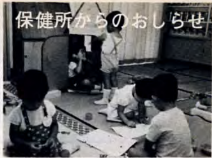
保健所からのお知らせ