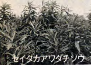
セイタカアワダチソウ

6月は、草が一番伸びる時期です。雑草退治は、いまごろ(つゆの前)が一番効果的です。