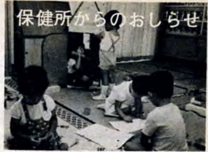
保健所からのお知らせ