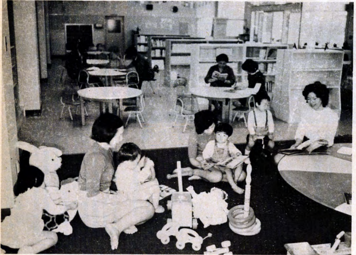
楽しさいっぱい、子どもと母のとしょかん