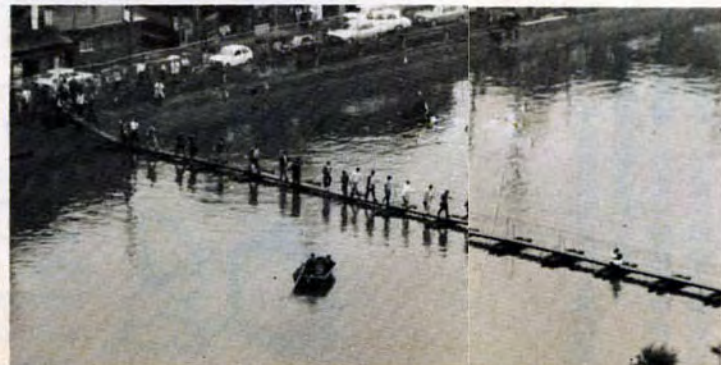
付近の市民も仮橋づくりに訓練

ヘリコプター一機、車両八十八台、人員一千余人、ほかに小型舟艇数隻……。6月5日、市役所前広場を中心に、大規模な総合防災訓練を行いました。 「大雨洪水警報発令下、北九州市は五百リを越す豪雨に襲われ、紫川がはんらん。各地でガケくずれが続発。電気、ガス、水道、電話もズタズタ。同時に繁華街のスーパーで火災発生」という想定。消防、警察、自衛隊、日赤、医師会、電々公社、電力・ガス会社、など十五の機関が参加。折からの雨をつけて、みごとに連けいプレーを展開しました。 ◇ 新市になって初めてという総合訓練は上々のできてしたが、本番におよぶことなく、訓練だけに終われば、これにこしたことはありません。 ◇ ことは、昭和28年の大水害からちょうど二十年目。心がまえも新たに、災害防止に取り組まなければなりません。排水路のそうじ、ゆるんだ石垣の修理など、日ごろの注意がかんじんです。 「小さな注意で、大事故防止」災害を防ぐのは、まずあなたです。