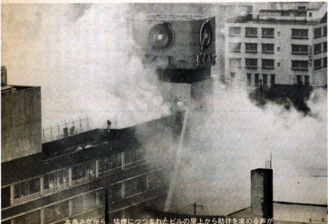
本番さながら 狂煙につつまれたビルの屋上から助けを求める声