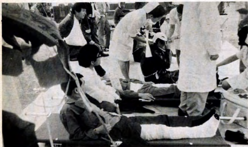
ふだに書かれた症状によって、応急手当をする