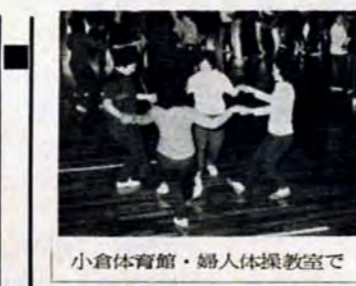
小倉市体育館・婦人体操教室で

海外移住相談と映画のテーマ 6月21日午後6時9時 小倉市民会館で、開かれは市経済局農政課2076へ。