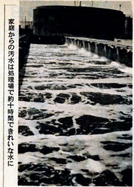
家庭からの汚水は処理場で約十時間できれいな水に

しかし、それも下水道あつてのことです。なぜなら水洗便所は、下水道がないところではもうけることができませんが、これは、経費の面でも下水道の場合の2~3倍もかかり、あとの維持管理費は比較になりません。その浄化そうの役目をするのが写真の終末処理場です。