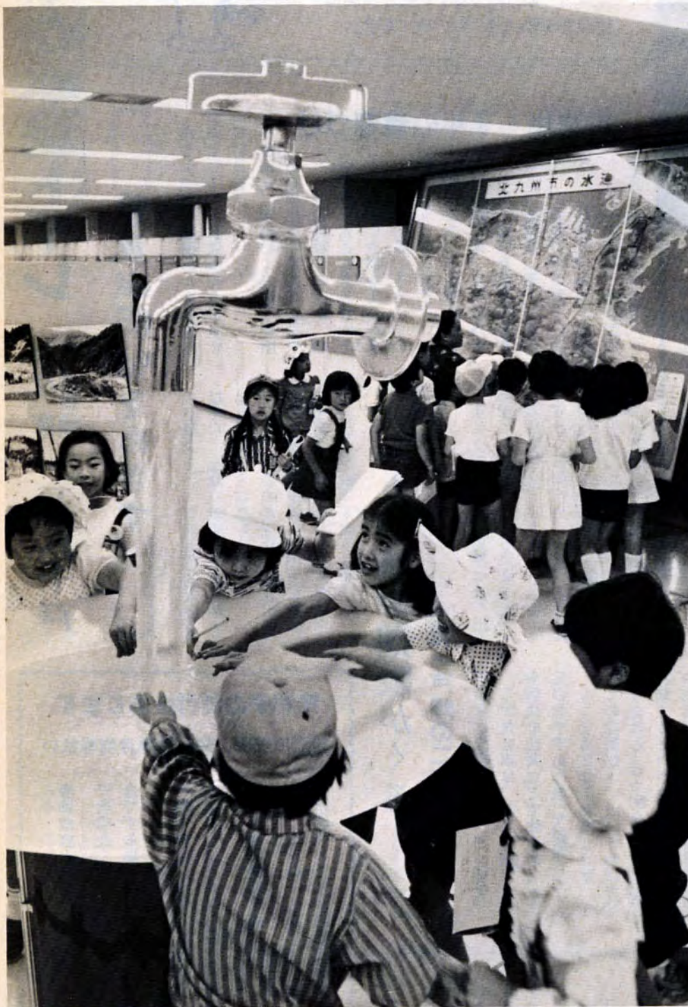
6月5日・水道展（市役所2階展示ホール）。