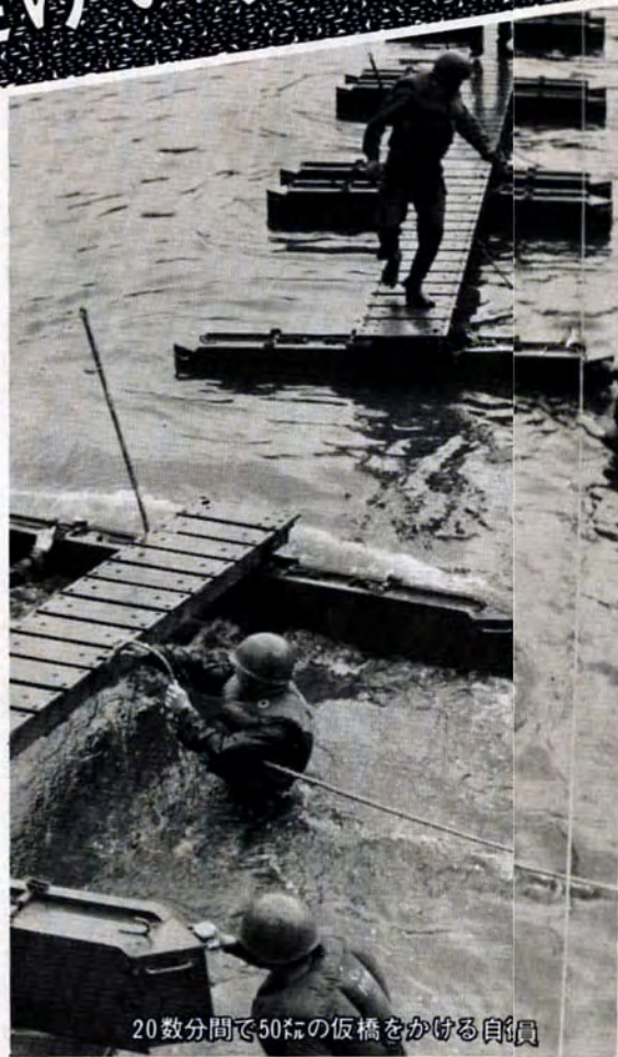
20数分間で50mの仮橋をかける自衛