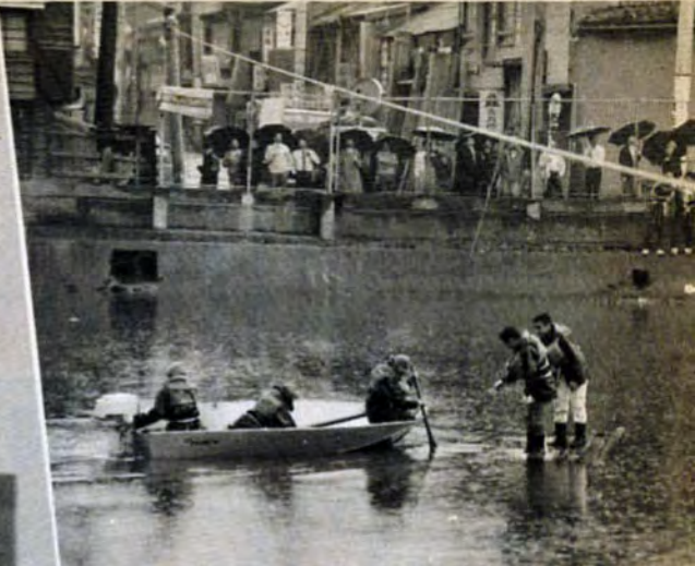
イカダにすぎた市民を救助する小型艇