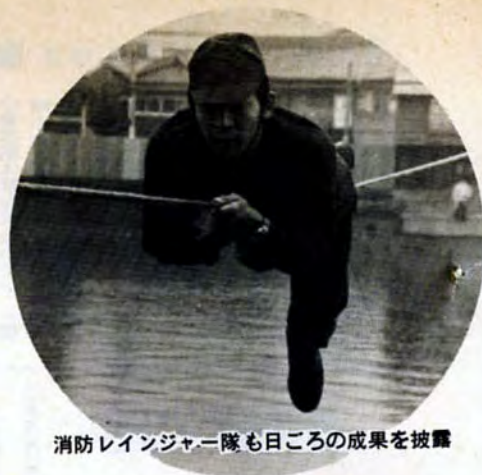
消防レンジャー隊も日ごろの成果を披露