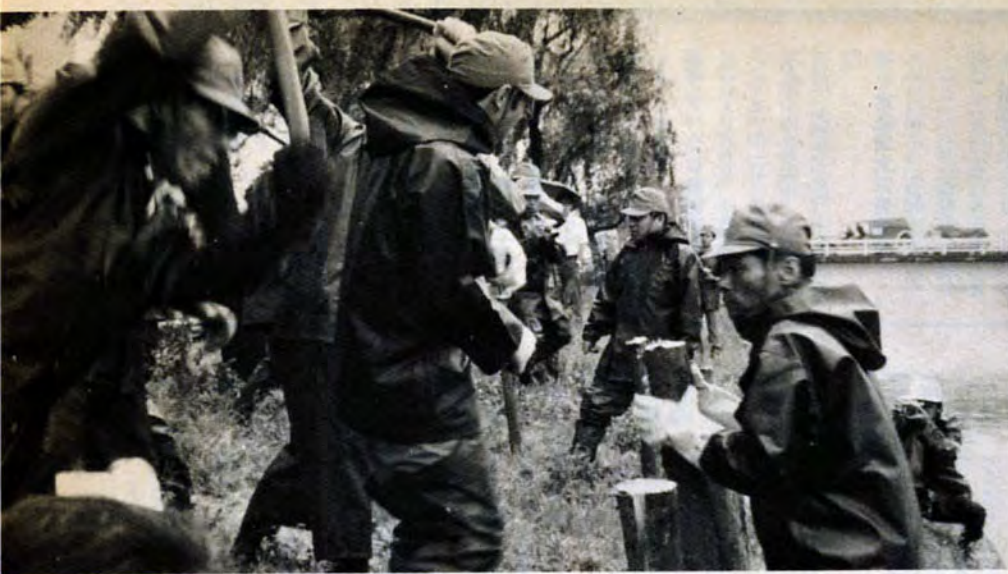
決壊した川岸補修は消防隊の海戦術で