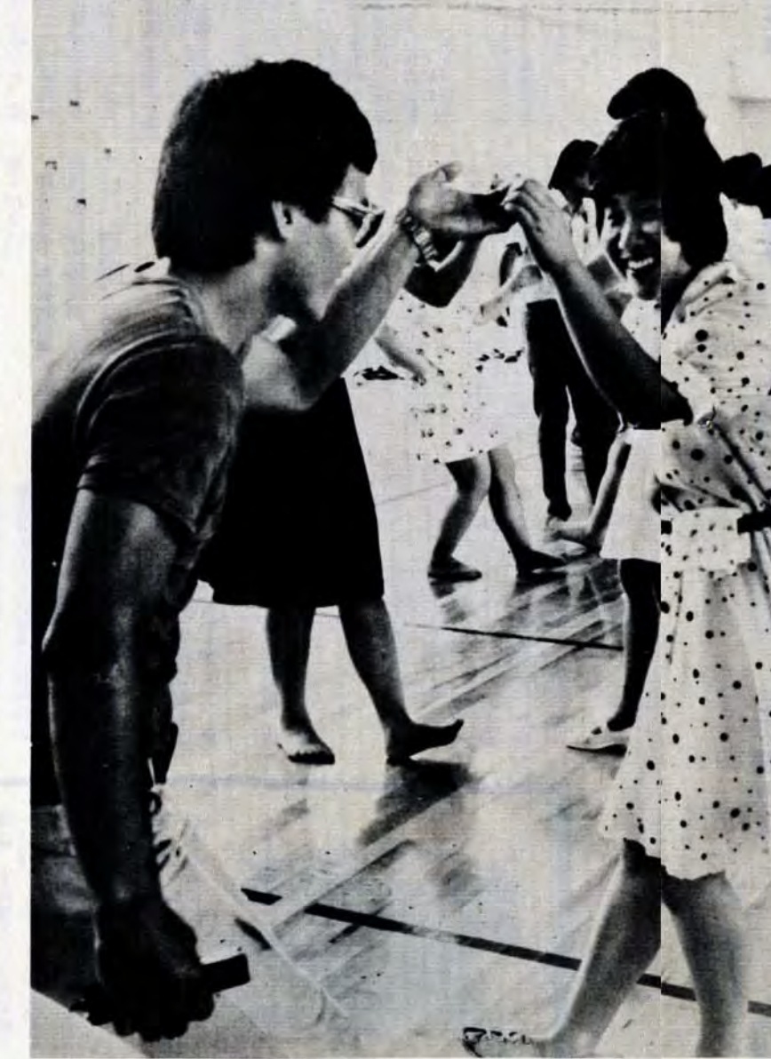
友情の輪が広がるフォークダンス

夜宮の森を西日が照らすころ、勤めを終えた若者たちが、夜宮青少年センターに集まってきました。汗まみれの若者で熱気がみなぎる体育館。音楽室からは歌声が聞こえてきます。印刷機器講習会も開かれていますし、ロビーや談話室で話し合っているグループもいます。 「友愛と創造」をモットーに夜宮青少年センターがオープンしてから4か月が過ぎました。 「久しぶりにスポーツをして汗を流した、非常に気持ちよい」「もっとこんな場所がほしい」「無料なので気軽に利用できる」「まわりの環境もよいし、部屋も