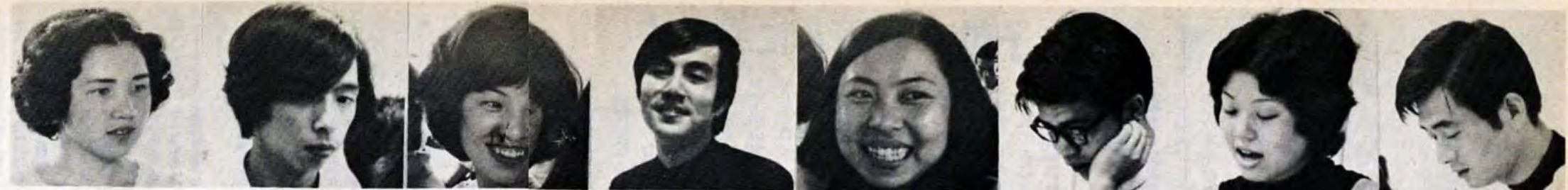
音楽を聞きたいとき・おしゃべりをしたとき・考えてみたいとき・何かやってみようとき…そして何をやってよいかわからないとき—

みなさんの道路を大切に 8月は、道路をまもる月間です。次のことに気をつけ、みなさんの道路を広く美しく使いましょう。 △道路、特に歩道を自転車や商品等の置場、作業場などに使わない。△車からタバコのすいながら、紙くず、空き缶等を捨てない。 道路の異常や苦情は区役所内建設事務所管理課へご連絡を。 市道認定の手続き 私道を市道に認定する場合、道路敷地の寄付者は次の書類を市に提出してください。市道認定申請書、土地登記簿謄本、土地無償譲渡承諾書、所有権移転登記承諾書、印鑑証明書、住民票、その他必要図面。分筆する場合の測量、関係図面の作成は市がします。お申込み、お問合せは8月31日までに各建設事務所管理課へ。 徳力土地区画整理事業 北九州都市計画事業徳力土地区画整理事業の事業計画が、7月18日決まりました。同事業地区内で次に該当する人は、それぞれの申請書の提出を早急にしてください。①地積訂正申請(登記簿に記載されている土地面積と実測面積とが異なるため異議のある人は、この決定の日から九十日以内に地積訂正の申請ができます。②建築行為等の制限(土地の形質の変更や建築物・その他の工作物の新築や改築、増築をする場合、市長の許可を受けてください。③権利の申告(土地の所有権以外の権利で登記のないものは、所有者と連署し、その権利の種類と内容を申告しなければなりません。手続等関係は、徳力区画整理事務所(小倉区城内1-1、市建設局区画整理部内、582局2472)へ。 都市計画道路の計画案 左図の都市計画道路(小倉駅大町線)の都市計画変更案を縦覧。期間は8月2日～15日、午前9時～午後5時(日曜、祝日は除く)。市建設局都市計画部内。この計画案に意見のある人は、縦覧期間中に、異知事、市長に意見書を提出できます。用紙は縦覧場所にあります。 問合せは、市建設局都市計画部都市計画課(803小倉区城内1-1、582局2454)か福岡県土木部都市計画課(810福岡市中央区天神二丁目1-1、78局1111)へどうぞ。