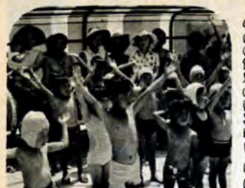
7月20日若松・小石市民プールで