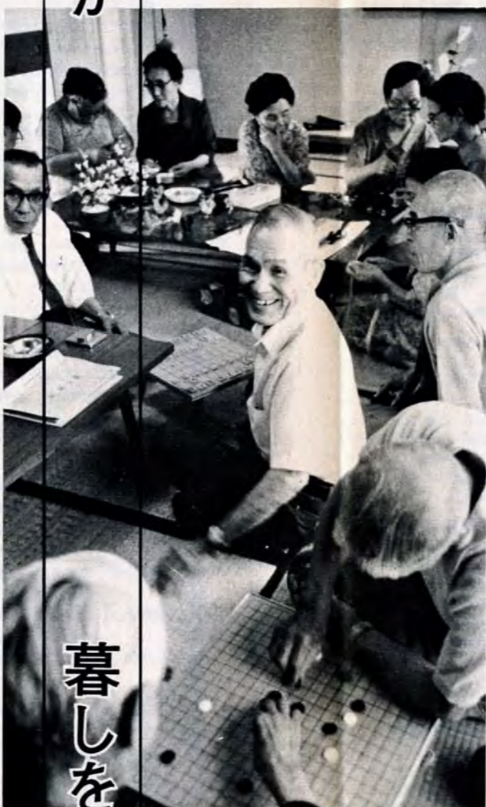
生きがいのある老後を— (戸畑区黒田公園老人いこいの家で)

▽スライド制を採用 インフレなど物価の上昇があっても、年金の価値が下がらないように、物価にスライドして年金額を上げる方式が取り入れられました。これは消費者物価指数が5%以上あがれば、その翌年に値上