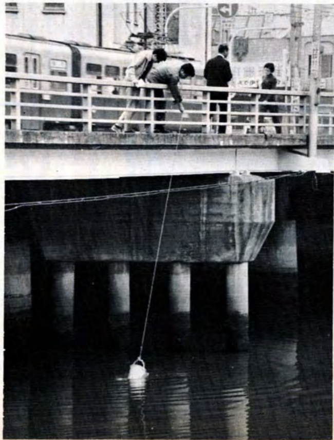
▲河川の検査は市内四十三か所で行なう