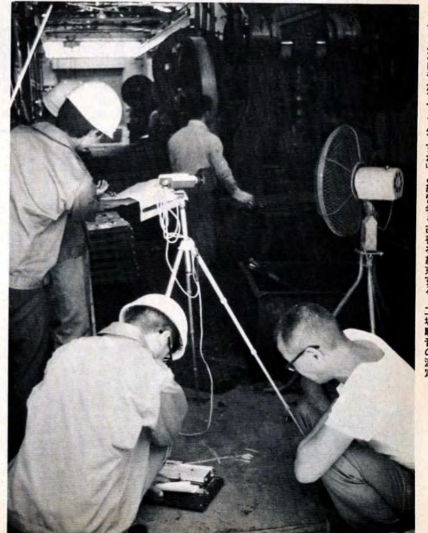
▲「こんなに音がでてるんですね」と経営者も改善を約束する 工場騒音の測定