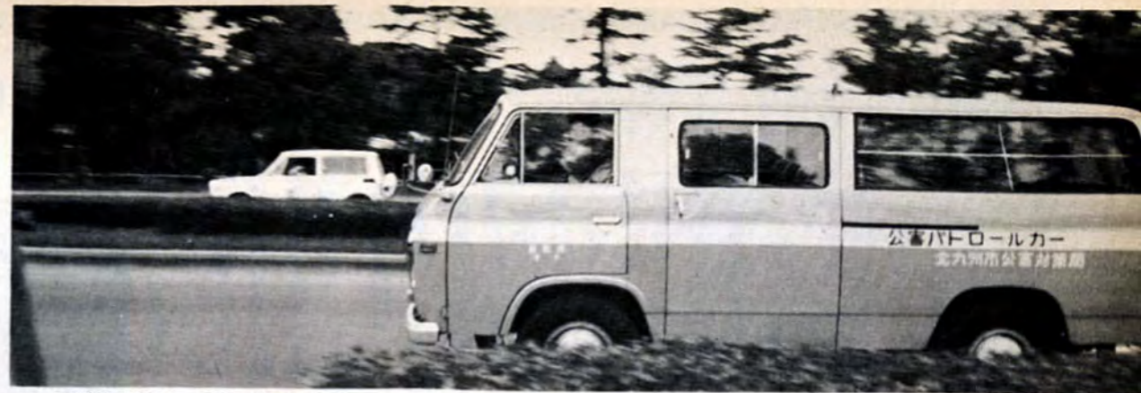
▲「神出鬼没」・公害パトロールカー