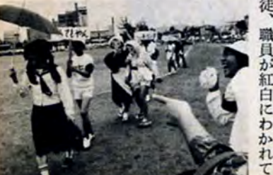
9月28日から6日間、小倉区のデパートで「北九州の社寺名宝展」が開かれました。市内の社寺に古くから伝わる書画、仏像、刀剣など初公開の宝物がいっぱい。観覧者の間からため息がもれていました。

このように、集まったみなさんの声は、市長や関係局に送り、施策へ生かしていきます。 市政らくがき帳は、みなさんの自由な発言の広場です。こういうことを市長に話したい、こんな知恵を市政に生かしたらどうか〜などどんな小さなことでも、絵で書いてもかまいません。住みよいまちづくりのために、あなたの建設的な提案を書いてください。 また、このほか市民のみなさんの声をお聞きしようとして「街頭市民相談」や「39サーブिस」「モニター制度」「アンケート」など多くの広聴活動を行なっています。お問合わせは、市広報室広聴課 592局2525へどうぞ。