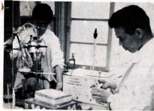
▲新しい分析は衛生研究所が引き受ける

彼らのスケジュールはいっぱいですが、青い空・青い海を取りもどすまではと、元気にとびまわっています。