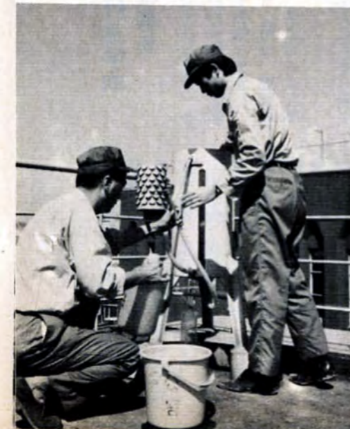
▲降下ばいじんと亜硫酸ガス測定器（市内三十一か所）