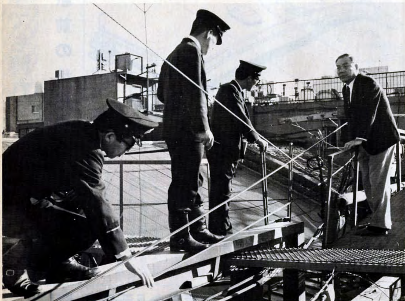
魚町アーケード上で