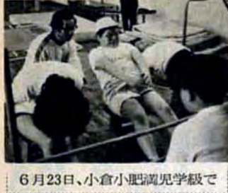
6月23日、小倉小児童遊学級で

市営バス 【市営バス】 市交通局運輸課 71局0331 折尾営業所 61局0132 丸柏営業所 71局3479 九州観光 61局2561 *日本三大急流・球磨川下 りと人吉温泉 6月8日・9 日(泊二日)。大人一万一千五 百円、子供八千二百六十円。 *柳川・川下りと白秋館を 訪ねて 6月23日、30日(日帰 り)。大人二千九百六十円、子供 二千五百円。 *木曾路黒部アルペンと飛 騨高山の旅 7月24日〜29 日(泊五日)。①7月24日〜29 日(泊五日)。②8月14 日〜19日(各泊五日)。定員四十 人。大人三万九千六百円、子供 三万四千四百円。 *水青海島船めぐりと鮮魚料 理 7月14日、21日(日帰り)。 大人三千円、子供二千六十円。