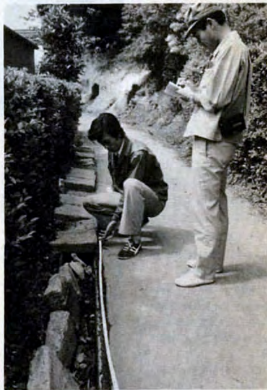
事故がおきてからではもうおそい——市民の苦情を受けてすぐ現地調査

室、など市民の声を市政に生かす窓口として利用されています。みなさんが出した要望や苦情は、『処理票』で担当課に調査や回答を依頼。担当課は、現地調査等を行いみなさんに回答していますが、これらの声の全部が実現するわけではありません。中には予算的に無理なもの、現実的でないものなどもあるからです。しかし、無駄にはなりません。これらの声もできるだけ市政に取り入れ、みなさんが何を望み、どのような市政を期待しているかを知る『住みよいまちづくり』の貴重な資料になるのです。このように市民相談室は、みなさんの声と市政をつなぐパイプとしての役割をはたしています。