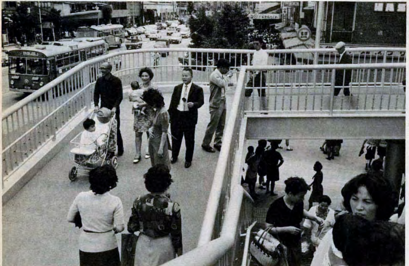
乳母車もこれで安心