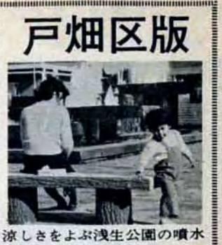
涼しさをよぶ浅生公園の噴水

参議院議員選挙 投票日は7月7日 午前7時～午後7時 あなたの一票が暮に反 映する選挙。ぜったいに 選ばれるまいと、投票者 旅をしないまでも投票を できないうる人も不だ く