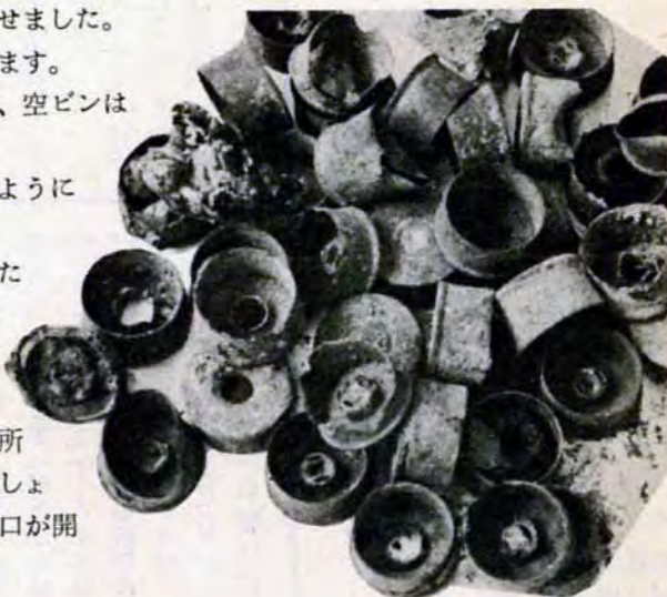
爆発したと思われる瓶詰の薬きょう、こんな危ないゴミも...