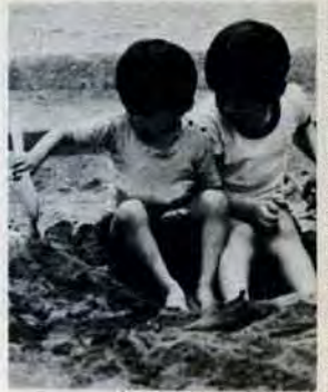
黒崎下ノ田公園で