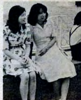
土曜コンサートで