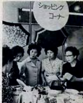
6月24日 門司消費生活センターで