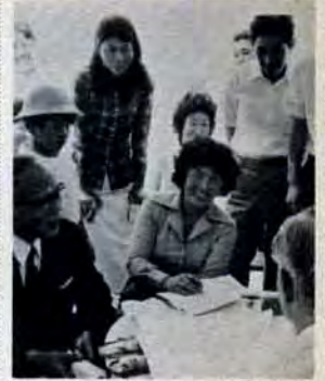
あおぞら市長室で