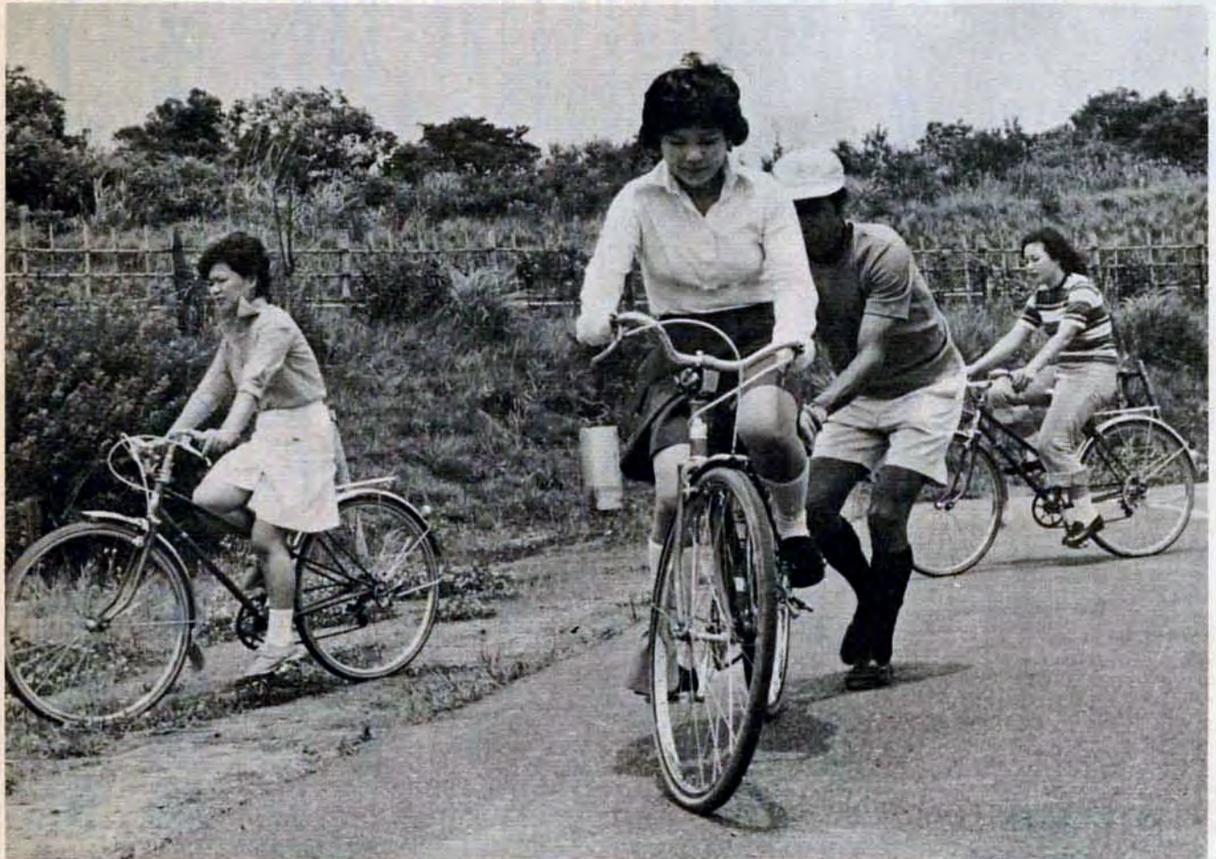
6月23日、「玄海青年の家つどいの広場」でのサイクリング教室