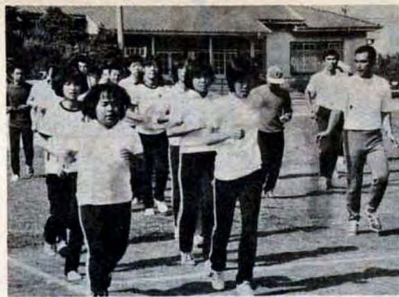
6月15日、鞘ヶ谷競技場で練習に汗を流す団員

北九州市は、スポーツ少年団友好代表団を中国に派遣します。スポーツ少年団友好代表団は、8月2日から15日まで北京市や旅大市などを訪問し、スポーツを通じて中国との友好を深めます。日本と中国との国交が回復したのは、昭和47年9月29日。それ以来、北九州市は中国との友好関係を進めるため、旅大市との姉妹（友好）都市提携の申入れや定期航路開設、領事館誘致をはじめ各界の交流促進を機会あることに積極