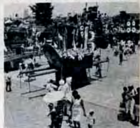
にぎわう戸畑紙園