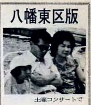
土曜コンサートで

〈予約電話のご利用を〉 区役所の市民課や課税課などの窓口は混雑時間（午前11時ごろや午後2時ごろ）は、なるべくさけていただくようお願いいたします。戸籍謄本や住民票などが必要なときは、予約電話681局0131をご利用ください。待たずに済みます。