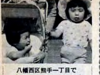
八幡西区熊手一丁目