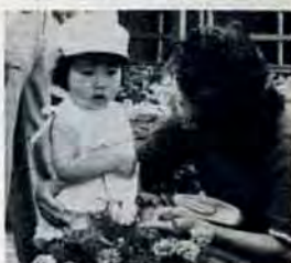
小倉市民会館裏で