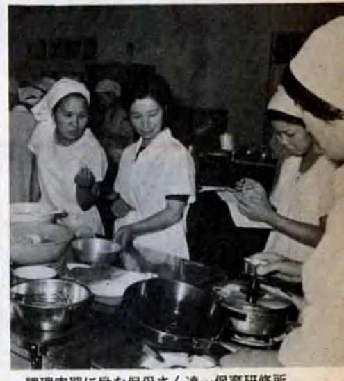
調理実習に励む母さん達…保育研修所