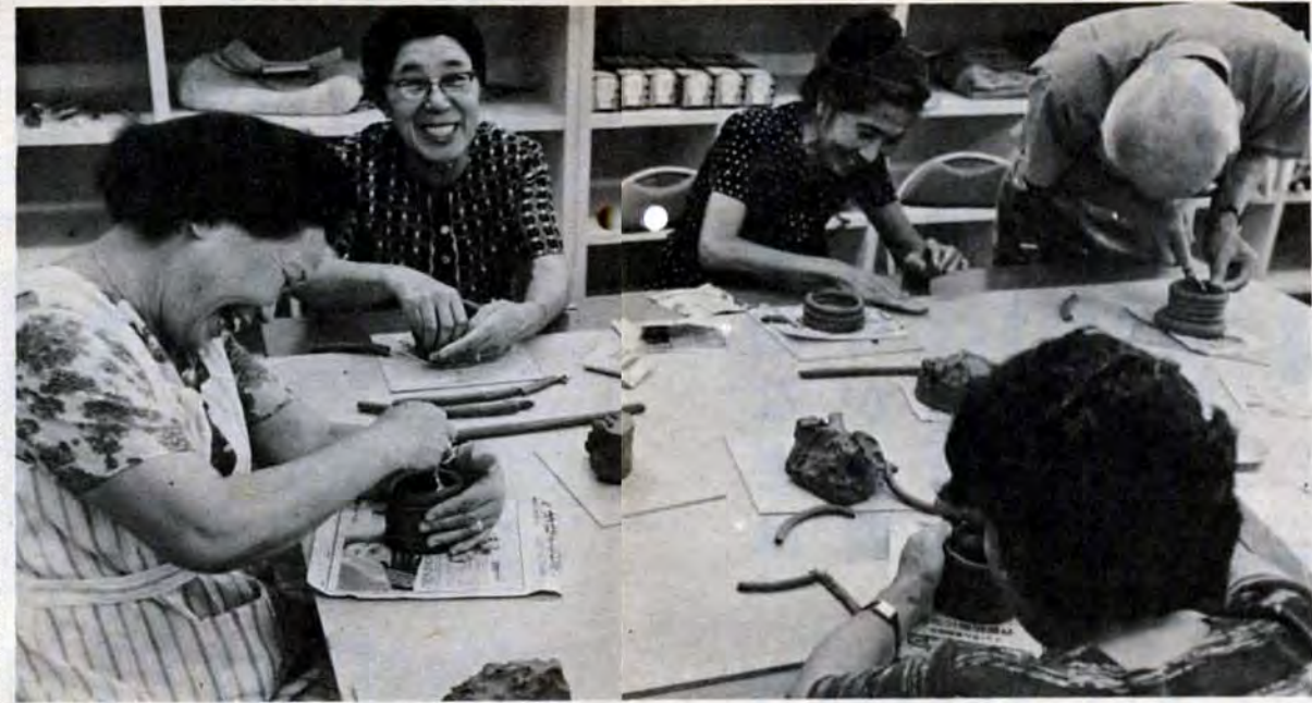
「土いじりも楽しいですね」…趣味の講座（陶芸）