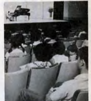
「お姉さんガンバッテ」音楽ファン待望の音楽ホール