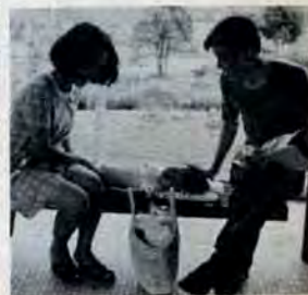
<市総合農事センターで>