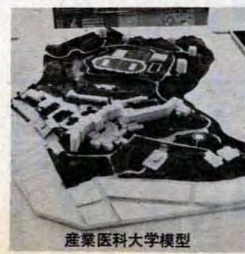
産業医科大学模型

さる6月、産業医科大学の建設構想が決まり、建設用地の買収をほとんど終わりました。 建設用地は、八幡西区折尾本城地区は、国鉄折尾駅の近くですが、繁華街のそばとは思えないほど静かで緑に囲まれています。 産業医科大学は、事業所で健康診断や職業病の予防、衛生教育など労働者の健康を守るための産業医師を養成するものです。 医学部は、医学科(二年八十人、六年)と大学院(二年三十八人、四年)、卒業研修コース(四十人)から成り、短期大学は、看護学科(二年八十人、三年)と臨床、環境検査技術学科(一年四十人、三年)から成っています。 附属病院は、病床数が八百、診療科は内科や外科、眼科など十五。 建設計画は、自然をできるだけ生かすことを主眼に進められています。産業医科大学の設置で、北九州市の医療水準は一段と向上し、公害病の発生防止、治療研究等に大きな役割を果たすことでしょう。