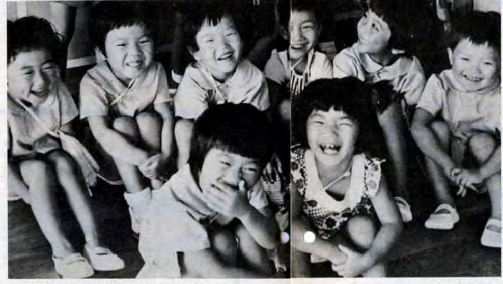
笑い声、泣き声が絶えない千防保育所