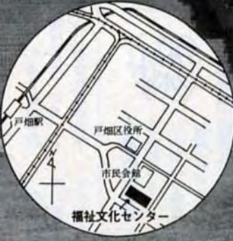
福祉文化センター