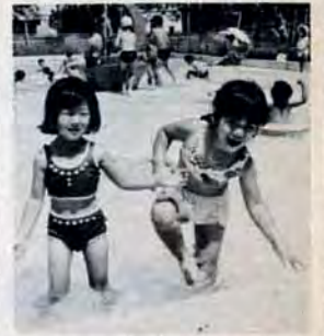
仙水児童プールで