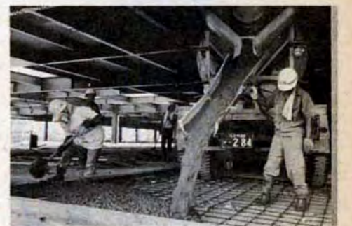
工事進捗状況約70%の青果棟

また、冬でもキウイやトマトを食べたい——など消費者の要求は多様化していますが、大きな市場だと全国各地から多種多様な生鮮食料品が集まるので、こうした要求に応えることができます。 新しい市場は、現在市内にある市場十四か所を一所に統合するもので、総工費は、用地代を含めて