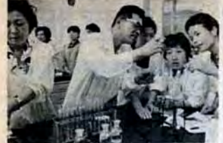
8月7日、消費生活センター(戸畑)の実験実習教室で。

▼申込と関係合わせ先 市交通局運輸課11局0031 丸根案内所11局3479 水四国、足摺岬と電車、桂浜、道後温泉、松山観光 8月31日、9月3日(三泊四日)。大人二万六千六百円、子供一万二千二百円。 水田主丸、巨峰ぶどう狩りと原鶴温泉 8月25日、9月8日(日帰り)。大人千八百九十円、子供千七十円。 水耕三寺と宮島観光 9月14日、16日(二泊三日)。大人一万二千九百円、子供九千円。 水秋の京都、大原・嵯峨野路と民宿の旅 9月27日、30日、11月26日までの間に十回(西泊五日)。大人一万八千円、子供一万四千円。