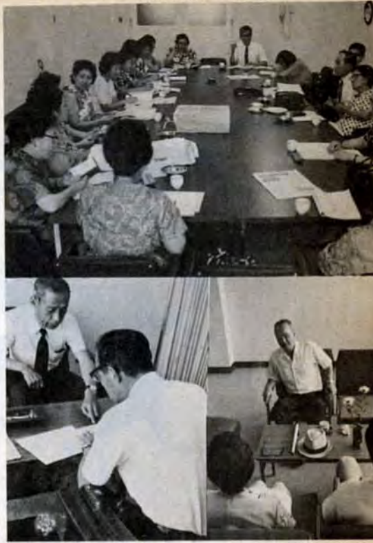
高年齢無料職業紹介所 身障者結婚相談所