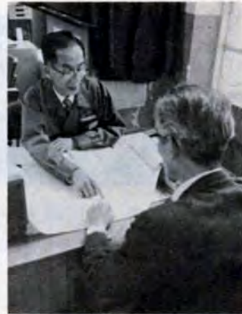
市役所一階広聴課で建築相談を受け付けています。また、各区役所内の審査課分室（小倉北区を除く）でも相談を受けています。ご利用ください