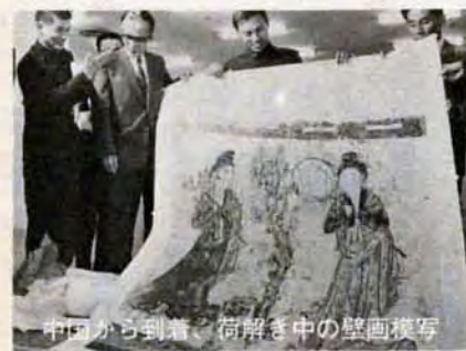
中国から到着、荷解中の壁画模写

本観覧時間と料金 午前10時～午後6時（入館は5時30分まで）。大人百円、大高生七十円、中小生四十円（二十人以上の団体と前売券、割引券は二十円割引）。 本障害者デー 毎週月曜水曜（11月4日を除く）9時～10時。本障害者と老人は無料。次の人は無料です。①身障手帳所持者②等級四級以上の介護者一人③療育手帳所持者④介護者一人⑤六十五歳以上の老人福祉手帳所持者。 本臨時バス（有料）35分間隔で運行。①②は途中のすべてのバス停止。③④⑤は途中のすべてのバス停止。⑥⑦⑧⑨⑩⑪⑫⑬⑭⑮⑯⑰⑱⑲⑳㉑㉒㉓㉔㉕㉖㉗㉘㉙㉚㉛㉜㉝㉞㉟㊱㊲㊳㊴㊵㊶㊷㊸㊹㊺㊻㊼㊽㊾㊿ ※北九州立美術館 戸畑区西鞘ヶ谷21-1、総局7777。