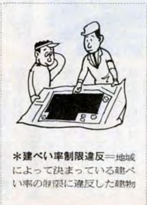
*無確認—法や命令、条例に適合しているという確認なしで建築（確認申請は、市建築局審査課や小倉北区を除く各区役所内審査課分室で受付けています）