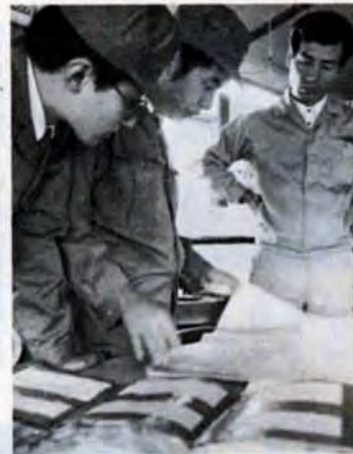
建築パトロールは、建築中のビルの建築事務所で責任者から説明を聞く。設計図を見つめる目が鋭い

あなたが家を建てる時、買う時大切なマイホームが違反建築物にならないよう気をつけましょう。わからないことがありましたら、審査課 582局2535へどうぞ。