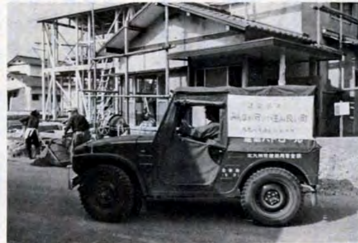
建築パトロールカーは一日に約50km走る。建築中のものはもちろん、すでに建っている建築物も見のがさずチェックする

マイホームを持つことは、人にとって生涯で大きな事業であり、買い物です。もし、建てそこねても買いそこねても、簡単にやりなおすことはできません。それだけにマイホームを手に入れようとする時には十分な注意が必要です。