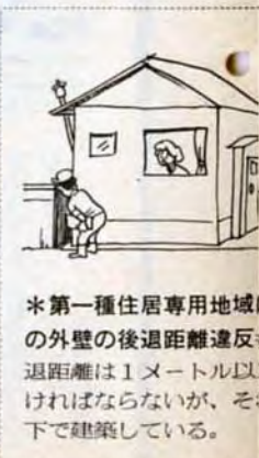
*建ぺい率制限違反—地域によって決まっている建ぺい率の制限に違反した建物