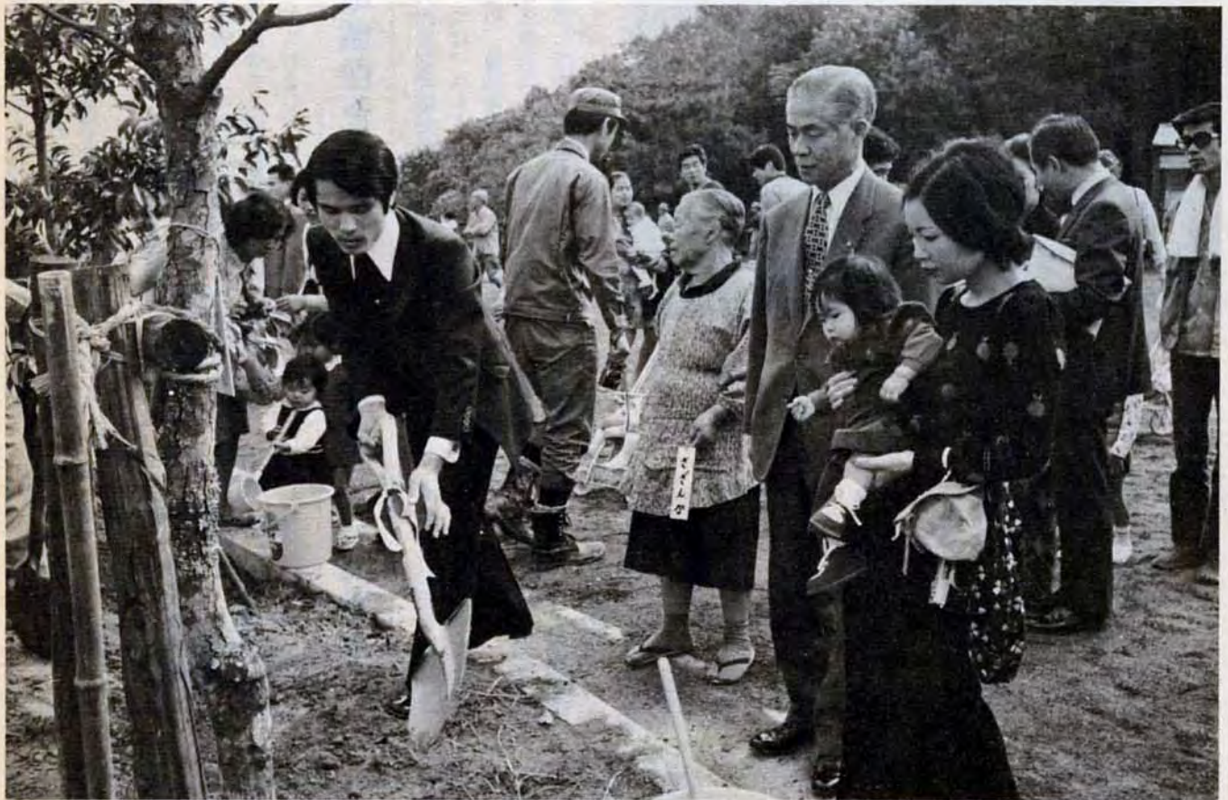
10月20日、八幡西区皇后崎公園で