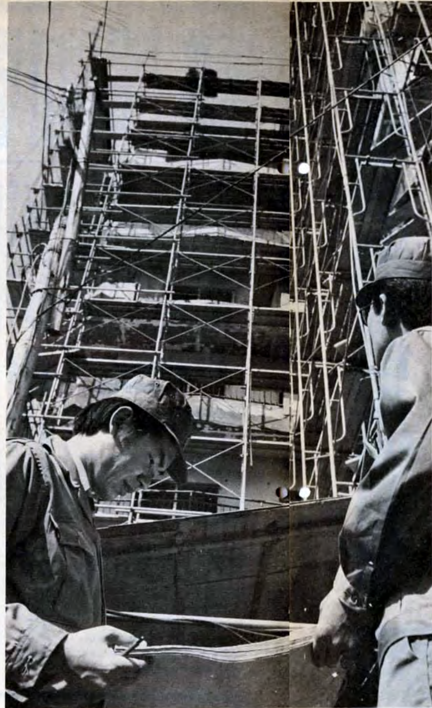
建築中のマンション。設計図どおり建てられているかなどを調べる

市は、10月1日から10月31日までの3か月間、第三次価格据置き協力店制度を実施しています。次の店を追加指定しました。