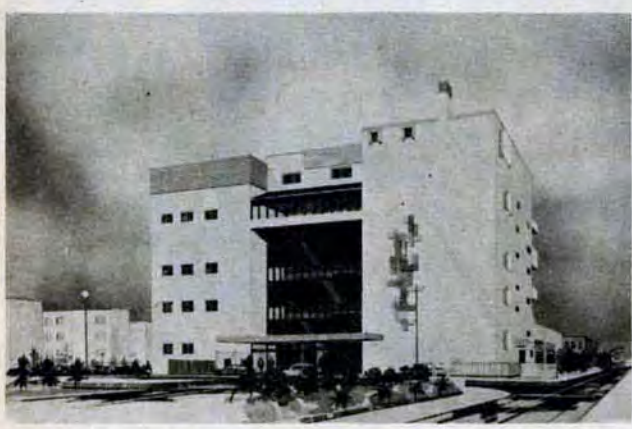
(上図) 小倉南区市民センター (小倉南区若園五丁目1番2号) (下図) 八幡西区市民センター (八幡西区相生町19番)