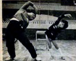
ママといっしょに 婦人トレーニング教室