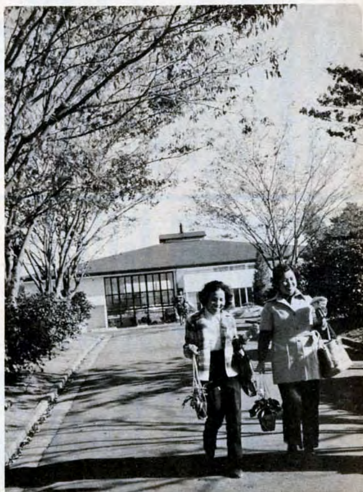
鉢植えの花など買物をすませて

紅葉の並木道を抜けると、北風の総合農事センターがあります。今、センターは、冬じたくが進んでいます。センターには、毎日、見学者が絶えません。昨年5月に開所してから、約三万七千五百人がおとずれています。 「特に、春と秋に見学者が多いですね。農家以外の人は、花を買いに来たり、どんぐりを拾いに来たり。家族づれでハイキングがてらに来る人も多いですよ。来春には展望台や日本庭園が完成するし、子牛も生まれます。どしどし、おいで願っていますね。」 総合農事センターの目的は二つ。一つは、近郊農業の研究と指導。もう一つは、土に親しめる農業を育てています。