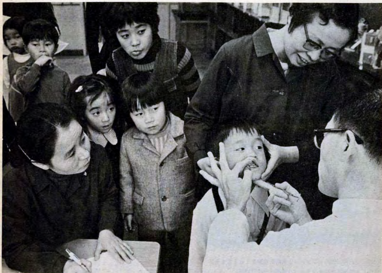
11月20日・小倉南区若園小学校で