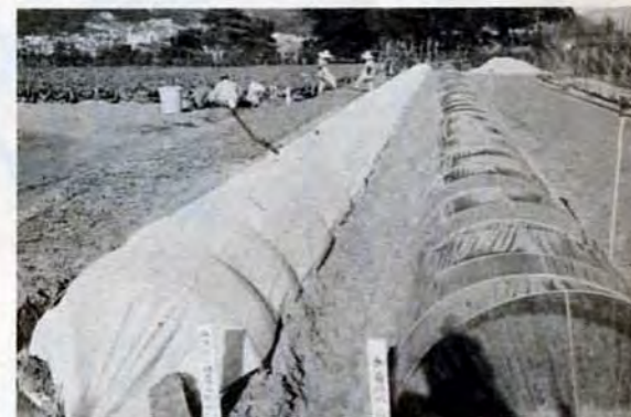
今、キャベツがいっぱい。まもなくカブができる

畜産施設落成を記念して、見学と緑化樹木・果樹苗木等の展示売会を開きます。日程は、12月13日~15日、午前9時~午後4時30分、総合農事センターで。主な展示即売品は、ヒマラヤシダ、山茶花、桔、梅、栗など。