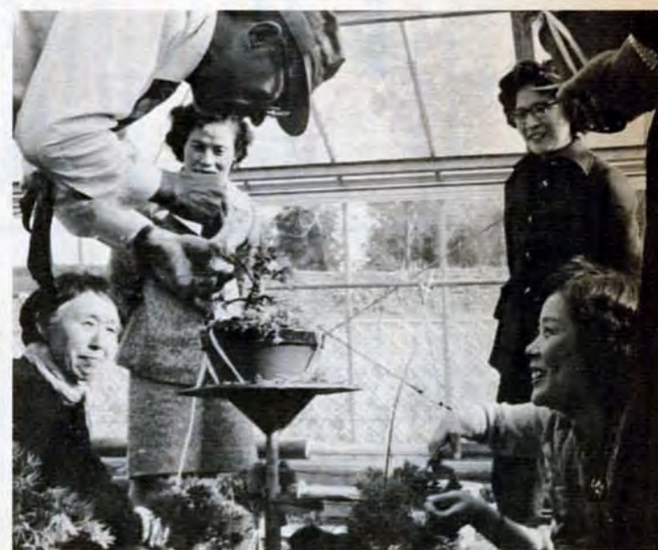
園芸講座—花や野菜の作り方、盆栽の作り方など教えている