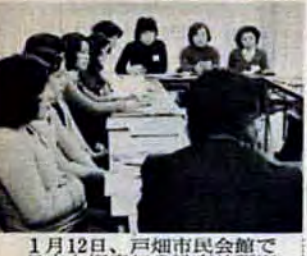
1月12日、戸畑市民会館で日中友好青年の船事前研修

心身障害者成人式 二十歳になった心身障害者(昭和29年4月2日より30年4月1日に生まれた人)の成人を祝福し、自立更生と社会復帰の意欲を燃やす同出を激励するために、成人式を催します