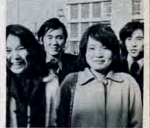
おめでとうはたち