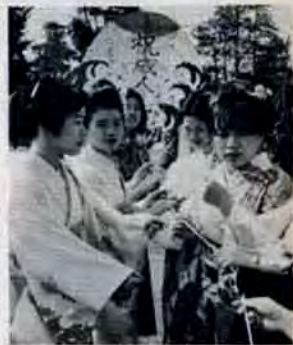
成人たこあげ (老松公園で)

☆新成人の声(成人式会場で) 年とったなあ・早く結婚しなくちゃ・働いてないから着物作らなかつた・着物きると父が喜ぶの・記念の桃の木植える所あるかな・同窓会みたい