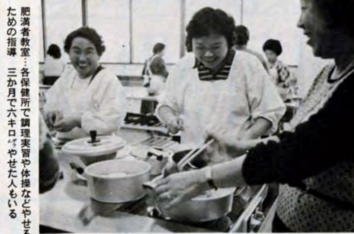
肥満者教室：各保健所で調理実習や体操などやせるための指導。三か月で六キロやせた人もいる