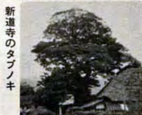
新道寺のタブノキ

【保存樹】①今津町、善教寺内、ビヤクシン ②恒見町、恒見八幡宮内、ホルトノキ ③同、モッコク ④同、ホルトノキ ⑤同、タブノキ ⑥小倉南区 ⑦新道寺山、タブノキ ⑧曾根山、天徳神社内、クロマツ ⑨若松区 ⑩小竹、白山神社内、ムクロジ ⑪同、イチヨウ ⑫大島居、妙泉寺内、イチヨウ ⑬八幡西区 ⑭香月2546、吉祥寺内、ノダフジ ⑮同、ノダフジ ⑯同、ノダフジ ⑰同、クロガネモチ ⑱香月3214-1、白岩観音内、クスノキ ⑲同、クスノキ ⑳同、イチヨウ ㉑山寺町12-30、一宮神社内、コバシモチ。