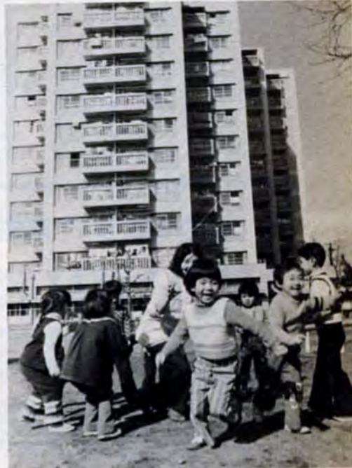
住宅の前は公園、お母さんの目とどく所で思いっきり遊べます(戸畑区初音団地)

市は、現在市営住宅の申込みを受付けています(申込みは6月末日まで、抽せんは7月か8月)、各区役所内市民相談室へどうぞ。