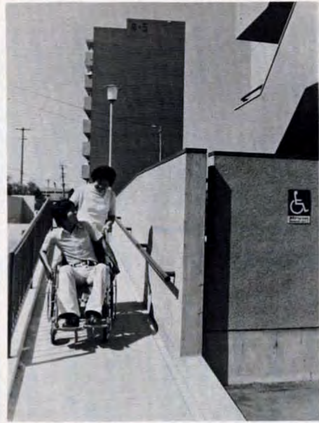
車イスで生活する人のためにスロープを取り付けました(工場移転跡に建てられた門司区大里団地)

市は、限られた土地を有効に利用するため、市営住宅の中・高層化を進めています。住宅を高層化することによって生まれる空地は、緑と遊具を備えた公園にしたり、一階に集会所や保育所、公設市場等を併設するなど土地の高度利用を図っています。