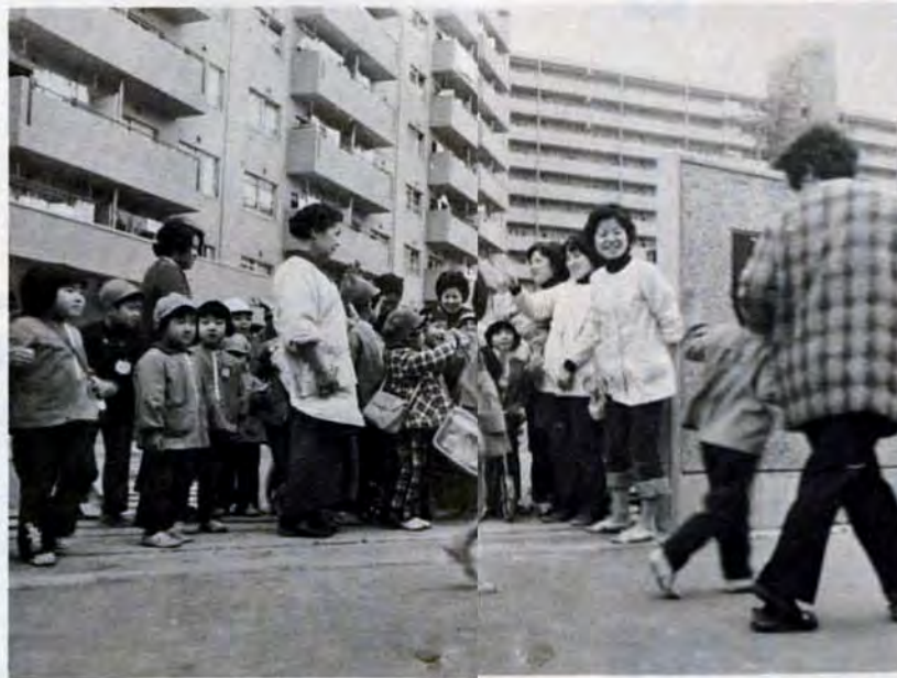
「先生サヨナラ」—高層住宅の一階に併設された保育所にお母さんがお出迎え(小倉北区ときわ台団地)