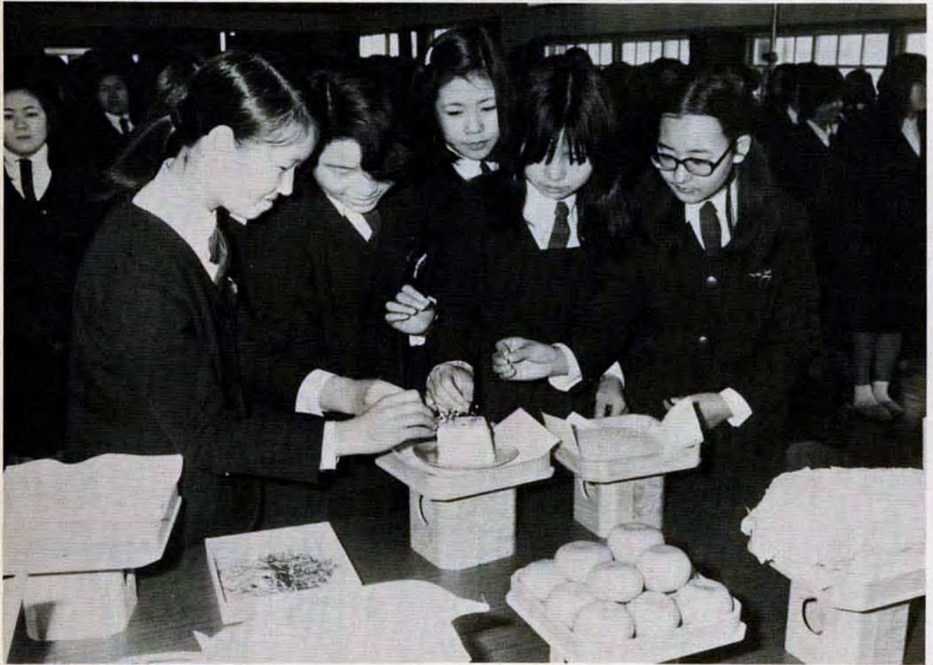
2月8日、戸畑実業専修学校で