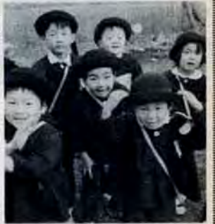
喰食・新地バス停で

栄養指導車の巡回 2月25日 午前11時から清見公民館で。 今月の献立は、大根と豚肉の 炒めもの、生揚げの甘酢あん かけ、ポテトスノーサラダ、 フライドチースポール。