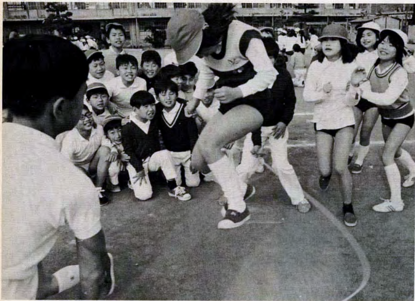
<2月18日、小倉北区三郎丸小学校で>