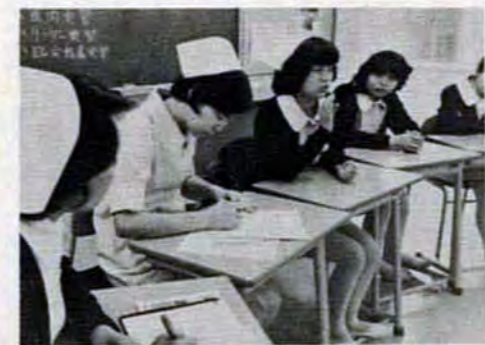
実習の反省会で問題点を話し合う(3年生)

昨年9月、新築オープンしたここ市立高等看護学院(市立小倉病院内)は、4階建てで看護実習室や、図書室、学生寮などがあり、66人の学院生が看護婦さんを目指して勉強中。3年間で一般教養のほか、ドイ