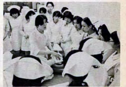
「患者の身になって看護を…」(看護実習=1年生)