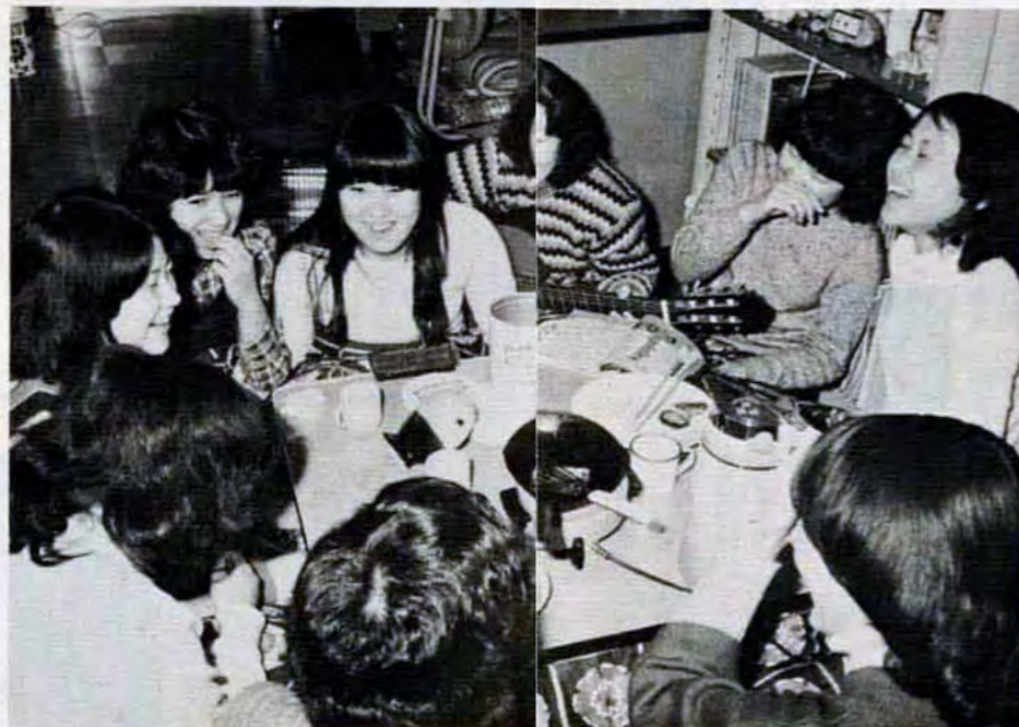
先輩のエッチなクイズに大笑い—は歌あり笑いありで毎日大にぎわい

【八幡勤労青少年ホーム】 ▼料理(水、木、金、各三十人)・習字(水、木、各二十人)・ペン習字(水、三十人)・野球(水、各十人)・ギター(水、各十人)・アーチERY(水、三十人)・時計(水、十人)・絵画(水、十人)・茶道(金、二十人)・空手(水、三十人)・社交ダンス(水、八十人)・卓球(金、十人)。 申込みは、3月11日午後1時から八幡勤労青少年ホーム(〒808八幡東区藤園三丁目5-1、661局2798)で、先着順に受付。