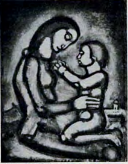
母たちに忌み嫌われる戦争

「ミゼレール」は、1948年に刊行されたジョルジュ・ルオーの銅版画集(限定四百二十五部)で、五十八点の作品が収録されている。左の作品は、「母たちに忌み嫌われる戦争」の題名が付けられている。幼い男を膝にした母親の静かな表情は、銅版による黒白の厳しい単純さ、強固なフォルムとあいまって、悲愴、残酷、苦しみを引き起す戦争に強く抗議している。