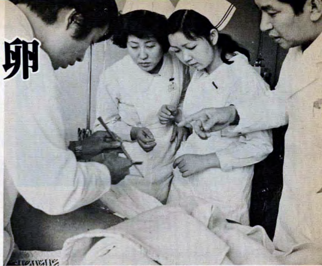
「これが傷口を縫っていた糸だよ」—医師のピンセットを食い入るように見る(回診の実習=2年生)