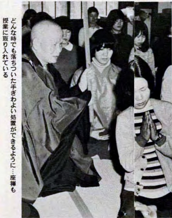
どんな時でも落ちついた手きわよい処置ができるように…座禅も授業に取り入れて

「ええ、授業中はいつも緊張しています。特に回診の実習で患者さんの治療に立ちあう時なんか、今だにカタクなりますね。早く先輩のように落ちついて、手きわよく行動できるようになりたいです」と2年生のA子さん。