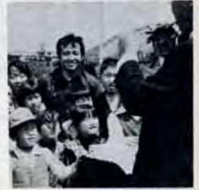
五月晴れの5月5日 交通公園で行われたこどもまつりマジック、竹馬、リームころがしなど盛りだくさんの行事に子供たちは大喜びでした。