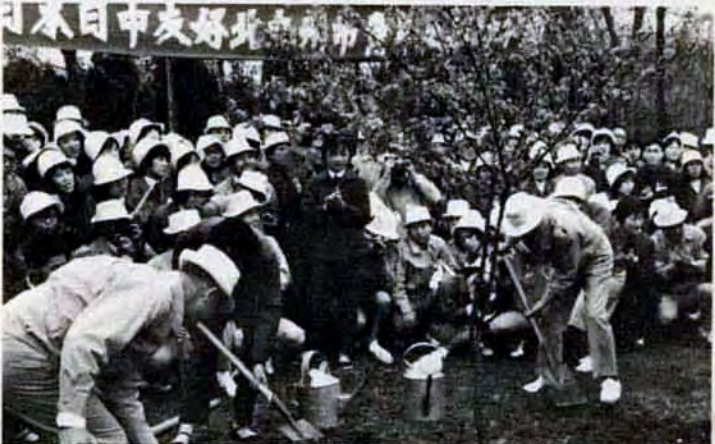
4月24日上海市西郊公園で、日中友好の記念植樹をした。ここでもたくさんの方が出迎えてくれた。