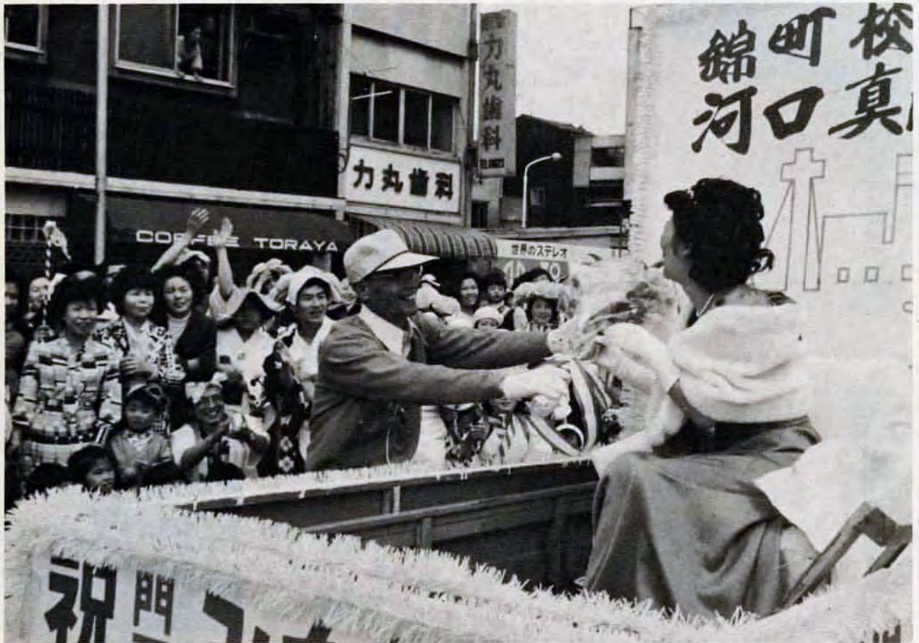
まつりに花をそえる *ミスみなと祭。(5月5日、棧橋通りで)