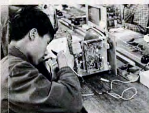
小学校の生徒は、学校を出てもすぐ社会に役立つに課外活動として、テレビ組立、木工、旋盤等強している。