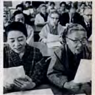
政治、経済から趣味のコースまで、いろいろな知識を身につけてもらう老人大学講座が5月6日開校。93人のお年寄りが元気に入学しました。