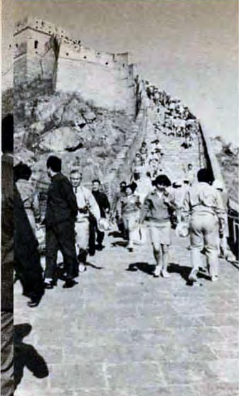
「万里の長城か。いまおれは中国にいるのだ」と、000キロにも及ぶ長城の上に立って、団員は大感激。

5月1日天津市民園体育場で、野球とソフトボールの試合を行った。中国の対外試合は北九州市青年の船チームが初めて。野球は7対1で日本、ソフトボール(女子)は10対4で中国の勝ち。試合終了後は、両国選手が手を取って、グラウンドを1周。2万人の観衆の声援に「ありがとう」のあいさつをした。上=中国選手にボール等を贈る日本のソフトボール選手。下=熱戦のつづく野球。