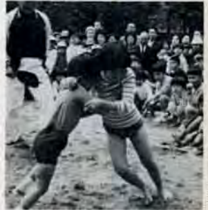
5月5日、新勝山公園と小倉城広場を中心に行われたこどもまつり。「男の子には負けないワ」と女の子(写真右)もすもう大会で大ハッスル。