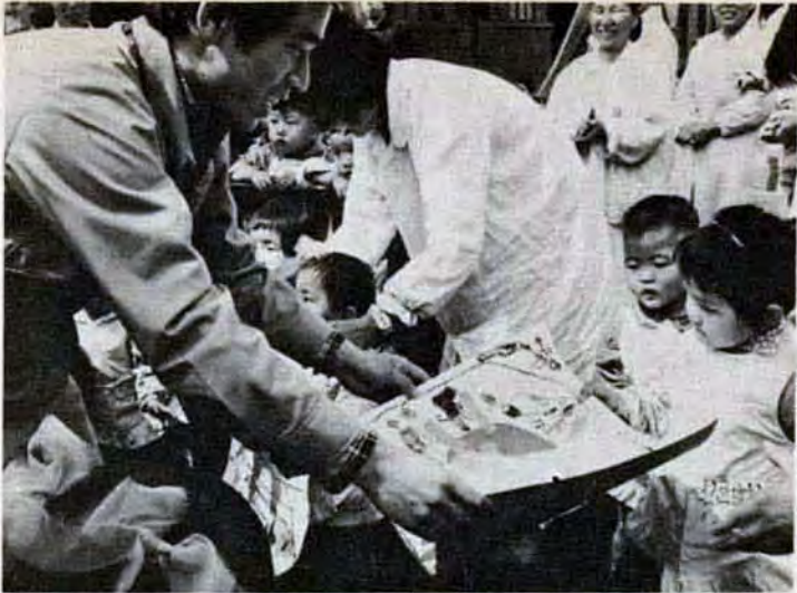
北九州市内の子供が描いた絵を中国に持っていき、工場内の託児所の子供達に送った。お礼に、子供達は元気いっぱい歌をうたってくれた。