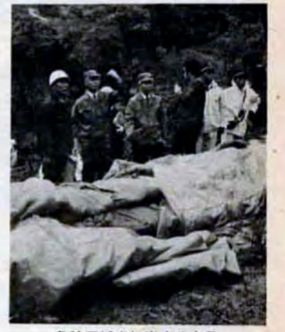
危険区域を視察する市長

必ず許可を受けましょう。▽ひび割れ、はらみ、傾いている、湧水がある、雑草などのものがはくずれやすいので早く修理を。 ＊宅地防災相談コーナー ▽10日八幡西区。いずれも区役所市民相談室で、執務時間中。 ＊防災総合訓練 ▽5月27日午前10時から門司区小松町・不老町・大里桃山町・柳原町一帯で ▽6月5日午前10時から小倉北区菜園場二・愛宕公園一帯、小倉南区守恒・権現堂池周辺、八幡西区則松・金山川馬洗場橋周辺、戸畑区東大谷二一帯で ▽6月5日午後1時30分から若松区二島・若松商業高校周辺、八幡東区日出一・枝光公園一帯で。