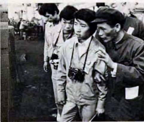
足ん挫した団員に、工場見学で中付添ってくれた村。本当にありがとう。