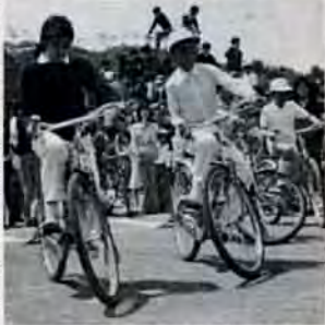
5月5日は児童文化センターで「子ども祭り」。八幡東・西区の子供たち約4,000人が鉄輪ころがしや竹馬のりなどを楽しみました。