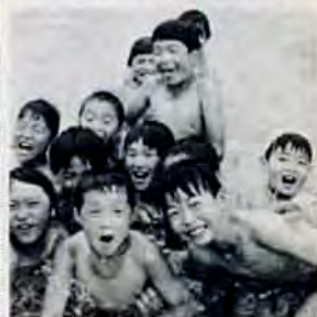
水しぶき・清見小プールで

■保健テレフォンサービス 582局8181 ■キッチンダイヤル 581局2418～9、2425～4