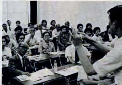
青少年問題懇談会(7月5日) 大蔵公民館 7月は社会を明るくする運動推進月間、各地でパレードや研修会などを開いています。

＊児童相談所 八幡東区尾倉三丁目4-36、TEL 8261。前もって電話をお願いします。 ＊家庭教育相談室 各福祉事務所内。電話かきでご連絡を。 ＊教育研究所 戸畑区椎ノ木町16-4、市職員研修所内、TEL 01