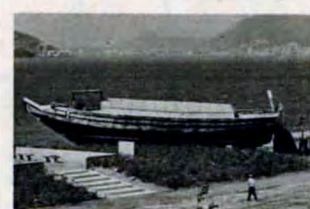
陸にあがった「はしけ」(長さ18.2メートル、重さ73トン)

「失われたつづつある海とのつながりを大切に——」。7月19日、小倉北区赤坂海岸に「延命寺臨海公園」がオープンします。午後1時から、同公園で消防艇の放水や巡視船「くろかみ」の船内公開などがあります。