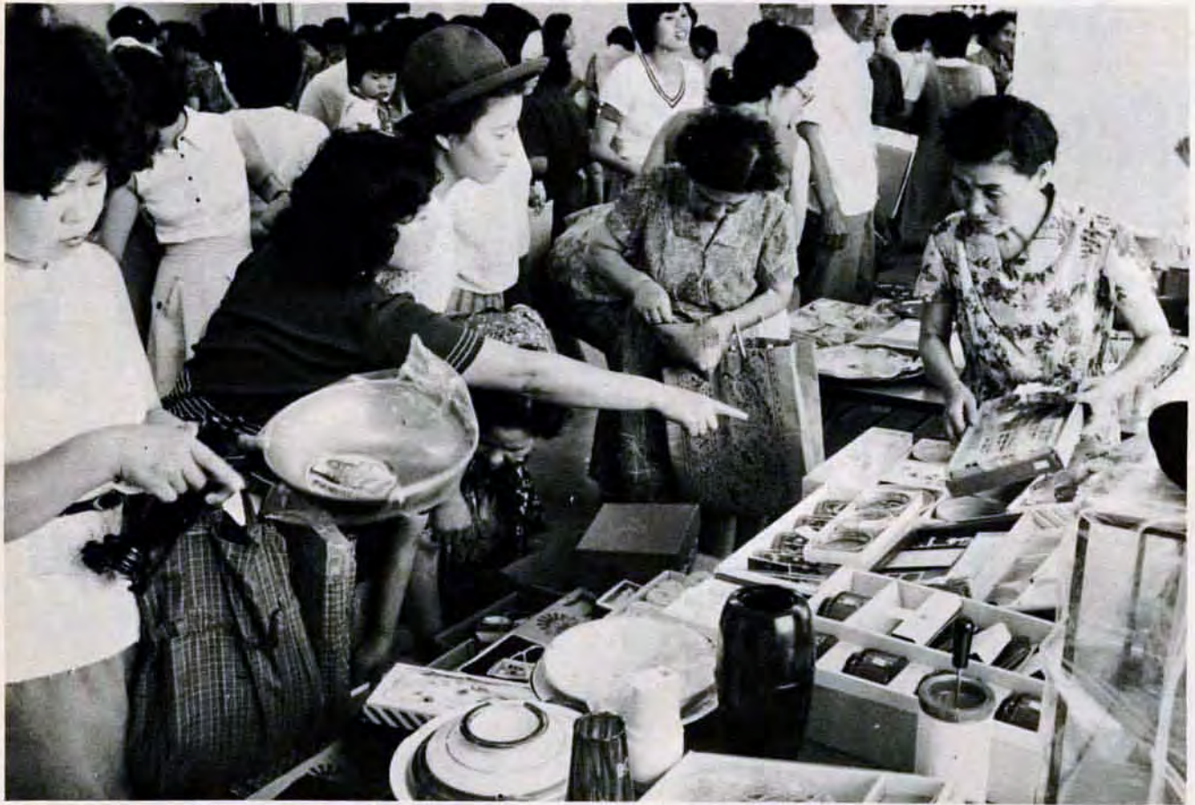
「不用品交流会」(7月7日・戸畑区の市立福祉文化センターで)