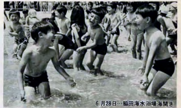
6月28日…脳田海水浴場海開き