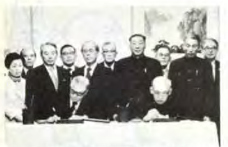
中国展開催会談要録調印(51年11月29日)