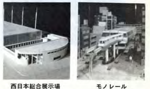
西日本総合展示場

市長 美術館がね、遠い遠いってうんですね。若い人までが、歩いていくと天気の良い日なんか気持ちいいんですが…… 今日長時間にわたつてどうもありがとうございました。今後健康で活力あるまちをめざしてがんばります。