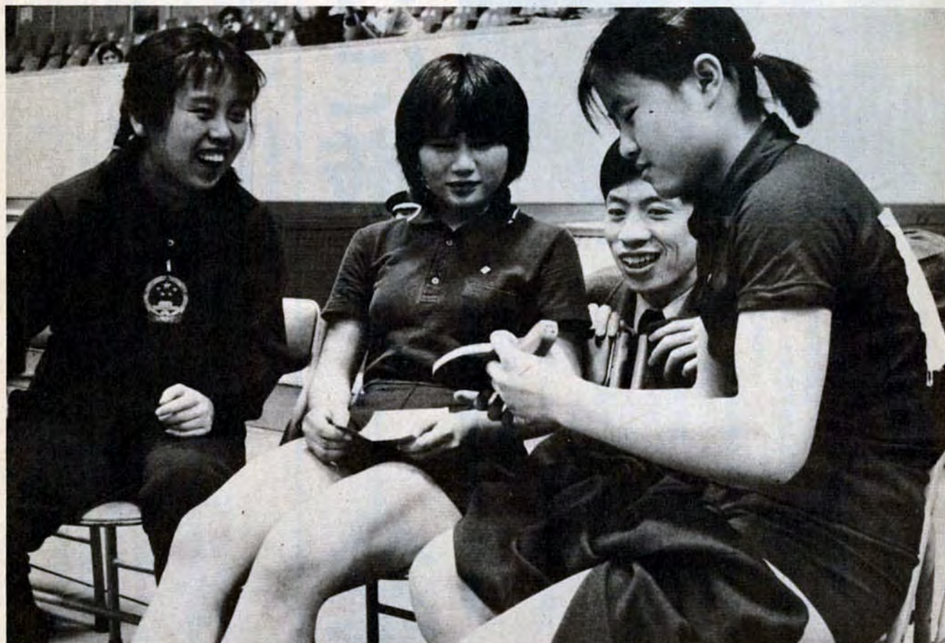
1月30日、総合体育館で