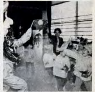
幼稚園児の防火豆まき

「ワー、火遊び鬼だ。やっつけろ、ノ」——2月3日、前田幼稚園で防火豆まきが開かれました。子供たちの防火意識を育てようと開かれたこの豆まきは、八幡東消防署が企画。耐熱服に鬼の面をつけた消防職員が発煙筒の煙の中から現われると、チビっ子たちは、思いきり豆を投げつけます。最後に消火器を持った園児の前に、二匹の鬼も降参。「火遊びはしません」と園児たちが約束して、楽しい豆まきを終えました。