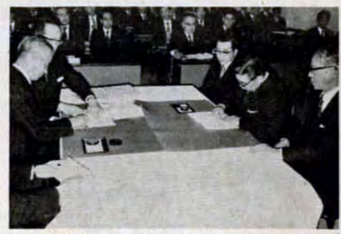
1月24日、57工場と公害防止協定の調印式

市内には、十五か所の環境大気観測局と五か所の自動車排出ガス測定所（騒音も測定）、三十一か所の硫酸酸化物質濃度・降下ばいじり量の測定点があります。環境大気観測局と自動車排出ガス測定所は、テレメーターシステム（注3）で市役所十階の公害監視センターと結ばれており、一時間ごとの各汚染物質の濃度を自