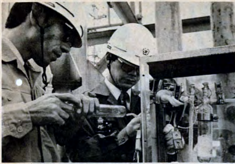
工場に立入り、有害物質を調べる

公害には、大気汚染、水質汚濁、悪臭、騒音、振動などがあり、私たちが悩まされています。中でも大気汚染は、呼吸器系統に悪い影響を与える原因にもなっています。その物質の一つに、硫酸酸化物質があります。この硫酸酸化物質とは、主に重油などの燃料に含まれている硫酸分が燃えると発生する汚染物質のことです。したがって重油などを燃料にしている工場や暖房用のボイラーなどから発生しています。市は、大気中の硫酸酸化物質を減らすため、43年から、着地濃度規制（注1）を実施し、工場や事業場等のばいじり発生施設ごとの排出量を規制してきました。この規制の効果で汚染濃度は、45年以降いじりしく低下（ピーク時の43年・44年に比べ50年は約三分の一）しました。しかし、この方法では、今以上