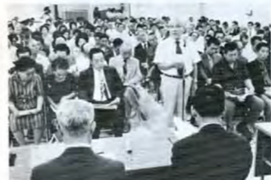
各区で区まちづくり会議が行われた

その「友の会を作ろうよ」と言う呼びかけのキッカケが欲しいのです。後は自主的に市民が参加してきますからね。