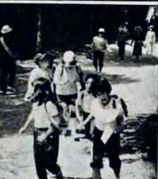
えんやえんや 5月18日 帆柱山まわりの登山大会で