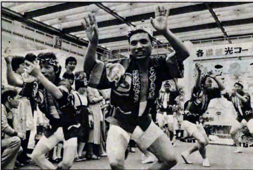
同じアホなら踊らにゃソソソソ-5月8日～12日、西日本総合展示場で開かれた「西日本ゆたかな郷土展」。北は長野県から南は沖縄県までの物産と郷土芸能がいっぱい。時ならぬ阿波おどりに「いい時に来たね」と来場者は大喜びでした。

★撮影協力ありがとう。本紙に掲載したあなたの写真をさしあげます。申込みは市広報室広報課宛2236へ。