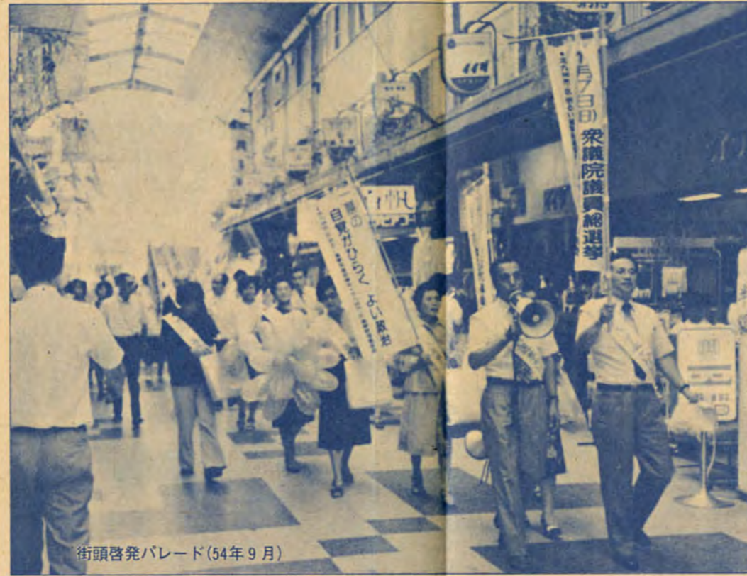
街頭啓発パレード(54年9月)

一九八〇年代最初の国政選挙として、衆議院議員総選挙と参議院議員通常選挙が、6月22日(日曜日)に行われます。 現在、国際情勢は緊張し、国内でも財政や物価問題など解決すべきいろいろな問題が山積しています。 あなたの一票が私たちの生活を守り、明日の日本をつくります。大切な一票です。「自分一人ぐらいは」といって棄権したりせず、候補者の政見をよく聞き、よく考えて、この人…と思う立派な人を選ぶことが最も大事なことでないでしょうか。 今回の衆議院議員総選挙と参議院議員通常選挙は、これからの国政をまかせる人を選ぶ重要な選挙です。 みんなで明るく、きれいな選挙をしましょう。