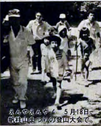
5月18日、八幡山まつりの登山大会で。