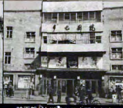
映画館で洋画や日本版も上映