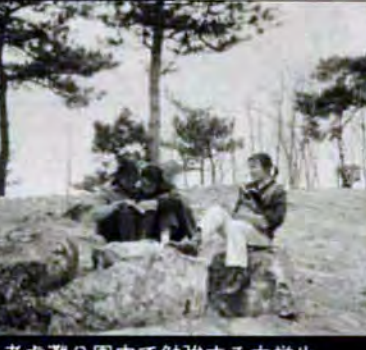
老虎瀟公園内で勉強する中学生