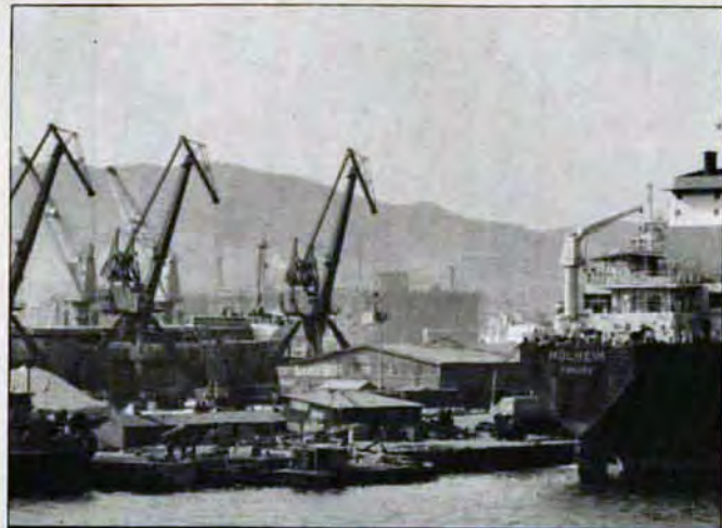
大型クレーンがならぶ大連港。現代化のいぶきがみなぎる