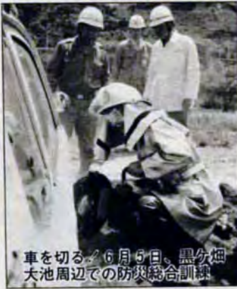
6月5日、黒分煙大池周辺での防災総合訓練

投票所が 変わります 6月22日に行われる衆議院議員総選挙・最高裁判所裁判官国民審査・参議院議員通常選挙から、次のとおり投票所を一部変更します。投票にお出かけのときは、入場整理券に書かれている投票所をよく確かめてください。 ▼本城市営住宅集会所で投票していた人は、柳原公民館（本城団地中央集会所と同一建物内）に変わります。 ▼東川頭町5番・7番・9番、西川頭町9番・12番、元城町、河桃町、大字藤田の一部（元城町二丁目）の人は、陣山中学校から八幡中央高等学校に変わります。