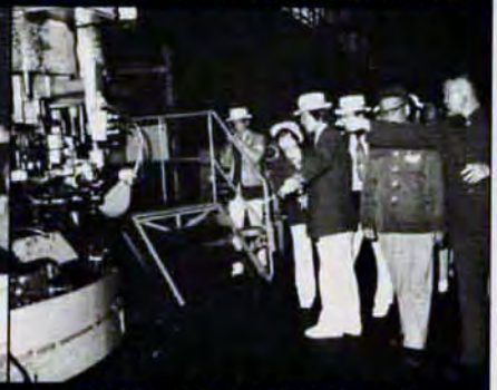
国内随一を誇る大連機関車工場

〇〇〇〇 福岡県保母試験Ⅱ試験は、8月5日、香蘭女子短大（福岡市南区横手二丁目四五）で。資格は、高卒以上か十八歳に達した後、実務三年以上の卒業者。応募は、6月18日、25日、およびの福祉事務所福祉課へ。 三級販売士・和裁検定試験ⅡⅢ級販売士検定試験は7月16日。受験料千七百円。申込みは6