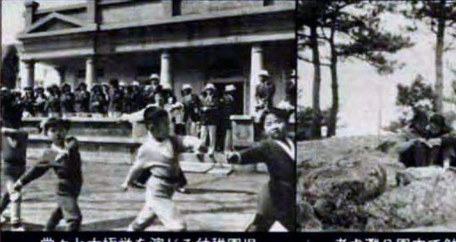
堂々と太極拳を演じる幼稚園児