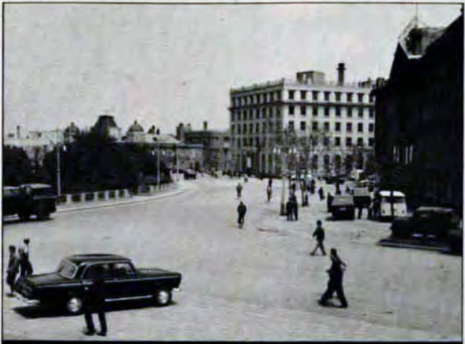
道路も広く、ゴミも落ちていない市街地

が残され、まるでヨーロッパのよう。郊外にも近代的アパートを建設中。 《市民》素朴な中にも、四つの現代化を目指すいぶきを感じられる。 《交通》人々の足は、二連バスや路面電車、自転車…。朝夕のラッシュ時には、道路いっぱい自転車が行き交う。 《産業》国内最大といわれる大連機関車車両工場では、蒸気からディーゼルに切り替え中。他に水産、紡績（レーズ、刺しゅう）産業等も盛んである。二千もの小・中学校がある。子供たちは、ハキハキとして積極的。どの子の目も輝いているのが印象的だ。 《娯楽》テレビと映画が二大人気。他に、京劇や曲芸、歌舞など。また、休日には、公園や景勝地、動物園などで、のんびりと過ごす。