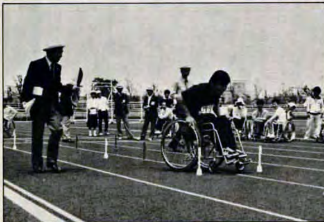
負けるな、がんばれ! - 6月1日、三萩野陸上競技場などで「北九州市身体障害者体育大会」が行われ、約420人の選手が参加。10月栃木県で開催の全国大会代表を目指して、熱戦を展開しました。