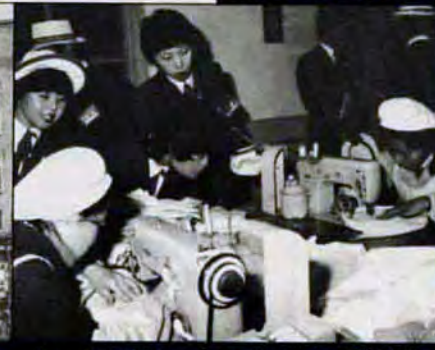
レースや刺しゅうの70%以上が輸出