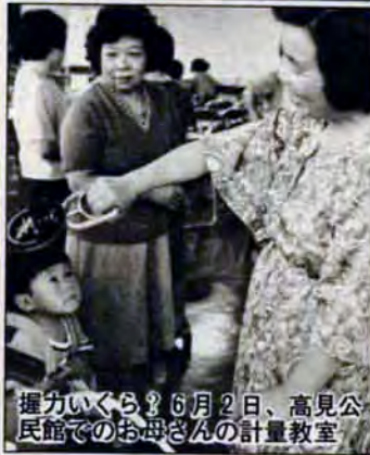
高見公民館での6月2日、運動会のお母さんの計量教室

【行政相談委員】●国・県・市等の仕事(環境衛生や保険、道路、交通、一般許認可等)についての相談・苦情をお聞きします。