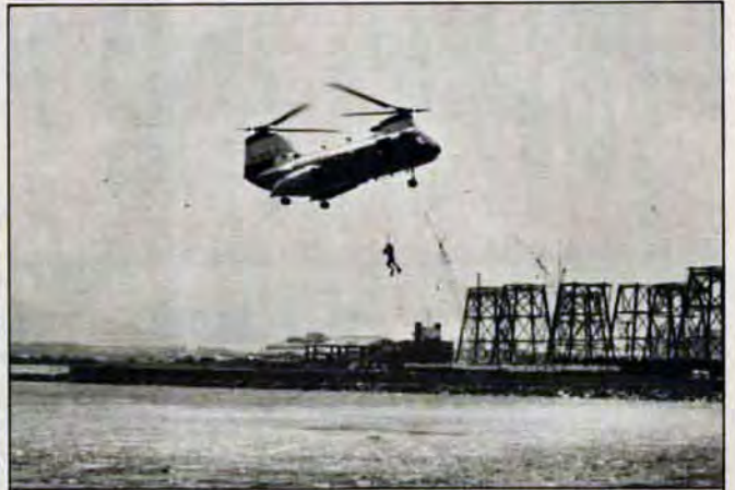
みごと漂流者を救助 - 5月28日、若松区警町で「市防災総合訓練」が行われ、約1000人、車両85台、ヘリコプター等9機、消防艇等9隻が参加。陸海空の息もピッタリの訓練を展開しました。