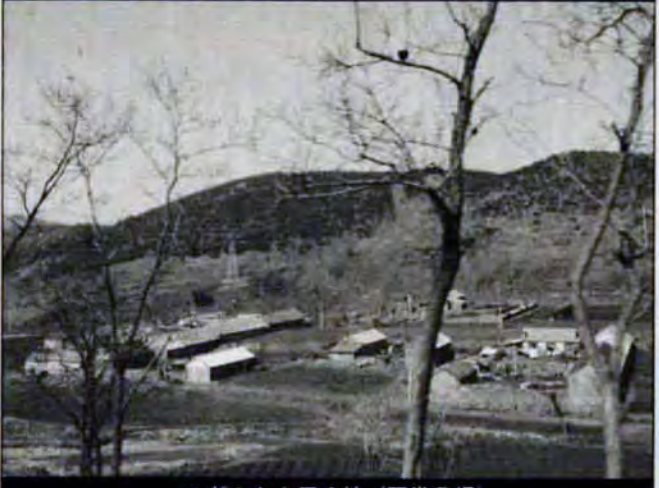
のどかな人民公社（国営農場）