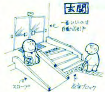
玄関 一番いいのは 自動式の手 スロープ

日頃、私たちが何気なく歩いている町や利用している施設は、意外と歩きにくかったり、利用しづらいことが多いものです。特に身体の不自由な人やお年寄り、病気の、妊産婦などの人々にとってこのような町や施設は不便なものです。これまでの町や施設は、知らず知らずのうちに社会生活上、障害のない人々の生活にあわせて