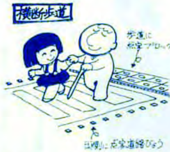
歩道に白線がアローフ 歩道に白線がアローフ

福祉の風土づくり——これは、身体の不自由な人やお年寄りなどが、地域社会の一員として生活していけるよう、市民が互いの立場を理解し、ふれあいながら幸せ