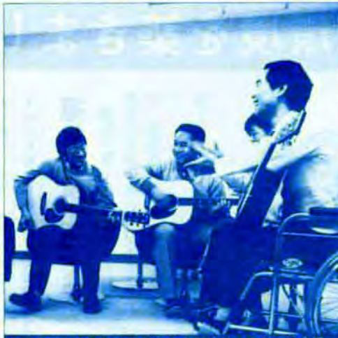
障害者福祉会館は障害者と市民とのふれあいの広場

北九州市は、昭和48年の「身体障害者福祉モデル都市宣言」に基づいて、これまで総合的な観点から障害を持つ人々の福祉の充実に努めてきました。国際障害者年を迎えたこの機会に、北九州市のこれまでの歩みをふりかえり、今後の障害者福祉の進むべき方向を、市民のみならず共に考えたいと思います。