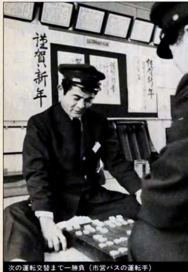
次の運転交替まで一勝負（市営バスの運転手）