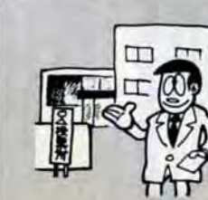
投票所が変わります

▶小石幼稚園は西14区公民館に ▶外小竹公民館は脇浦公民館にそれぞれ変更します。