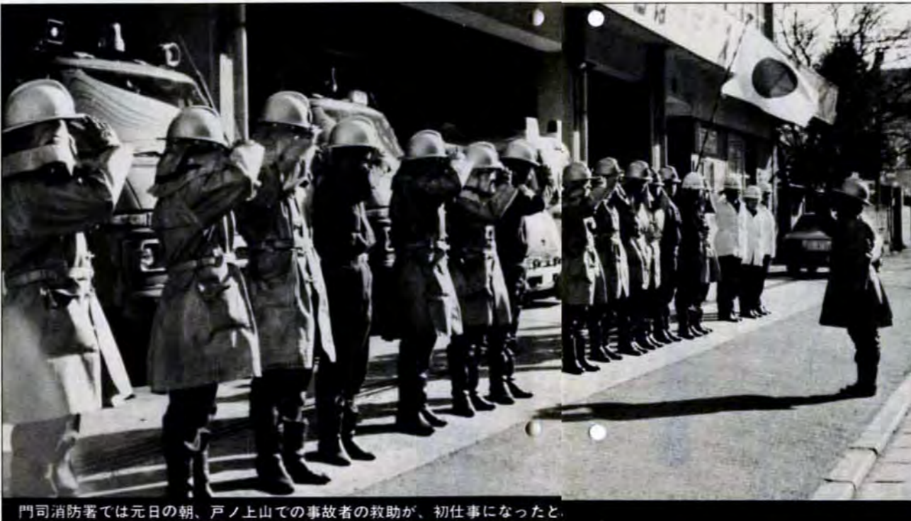
門司消防署では元日の朝、戸ノ上山での事故者の救助が、初仕事になったと