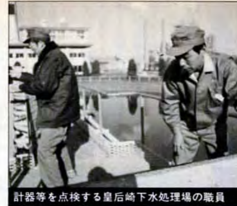
計器等を点検する皇后崎下水処理場の職員

ちなみに、夜間 休日急患センターの12月28日～1月4日の急患受付件数は、3,691件で、1日平均460人（平日の4倍）。しかも、1月2日には、「正月ベビー」が誕生しました。