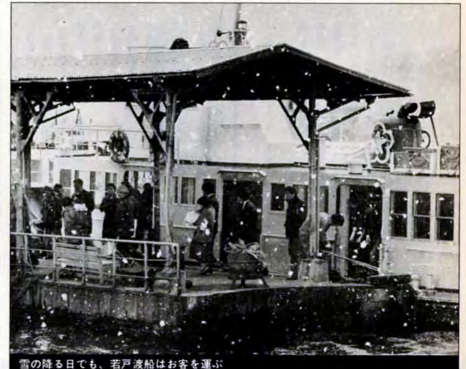
雪の降る日でも、若戸渡船はお客を運ぶ

○学生募集 市立青少年技能者養成所 資格は中卒後2年以内の人。募集は、機械科三十人、自動車整備科二十人、溶接科二十人。修業は1年間。応募は、1月31日までに同養成所（八幡東区勝山二丁目7-15、65局4775）へ。 市立高等美容学校 資格は、中卒以上の人（年齢・性別は問いません）。募集は、理容・美容科各百人。修業は1年間。入学金千円。授業料月千二百円。実習費は、理容科三百円、美容科四百円。応募は、2月14日までに同学校（八幡東区勝山二丁目7-15、65局4775）へ。 市立戸畑高等専修学校 資格は、▼本科：中卒の女性。定員八十人。▼専門科：本校研究科卒か同等の学力を持つ女性。定員三十人。試験は、2月24日、同校で。応募は2月2日～16日に、願書と調査書を出身学校長を経て同校（戸畑区西大谷一丁目6-29、87局4794）へ。 小倉総合高等職業訓練校 資格は中卒以上の人（機械製図科は高卒以上）。訓練科は、機械科、溶接科、自動車整備科、ブロック建築科、製版印刷科、塗料科、機械製図科。定員は、十五人～四十五人。応募は、第一度が2月21日まで、第二度が3月23日まで。問合せは、同校（小倉北区三郎九丁目4-1、82局7091）へ。 7へ。なお、婦人服の新調、更正、修理の注文にも応じています。 福岡県青年の船の団員募集 資格は、1月1日現在で20歳～25歳の日本国籍を持つ未婚の人で、県内に1年以上住み、これから同居する人。日程は、5月16日～29日。訪問地は、奈良、東京、北京、青島。募集は、一般団員三百人。費用は六万円。応募は、1月7日～31日に関係書類を添えて各中央公民館へ。関係書類は、市教育委員会青少年課（市役所14階、82局2392）と各中央公民館でどうぞ。 陸上自衛官（二等陸士）を募集 資格は、18歳～24歳の男性。勤務は、小倉部隊。くわしくは、自衛隊募集事務所（82局3466）へ。 国民宿舎めかり山荘の写真コンテスト 資格は、アマチュアの人。作品は、めかり山荘をテーマにしたもので、未発表のものに限ります。点数制限はありません。応募は、カラープリント（四ツ切限定）で、4月30日までに国民宿舎めかり山荘（門司区めかり公園内、321局5538）へ。