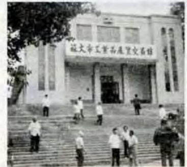
会場となる交易館

北九州市は、友好都市の中国・旅大市で、交流の促進と産業・貿易の振興を目的に「日本北九州工業展覧会」を開催します。 会期 10月5日～18日(十四日間) 会場 旅大市・工業品展覧交易館 この工業展覧会に出品する、または出品しようと思う会社や工場、事業所などに、出品説明会を行います。ご自由に参加ください。 日程 1月16日午後2時から、北九州商工会議所9階大会議室で。 出品対象 ▼北九州市内で生産される工業製品、製造設備等 ▼旅大市から提案された工業製品、製造設備 ▼電子製品、計測品・メーター類、繊維製品、プラスチック製品、家庭用電気器具、家庭用生活用具、家具類、皮革製品・製造設備、工芸美術品、玩具、食品、日用機械、硫酸塩製品、化粧品、包装・印刷の材料や製造設備、化成製品、機械、冶金、建築材料、数学・製図器具など。 なお、出品申込み、技術説明会申込みの受け付けは、3月14日までです。 問合せ 日本北九州工業展覧会開催委員会事務局(☎82小倉北区城内1-1、市経済局貿易課内、82局2062)へ。