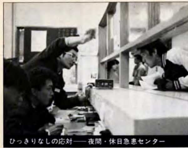
ひっきりなしの対応——夜間・休日急患センター