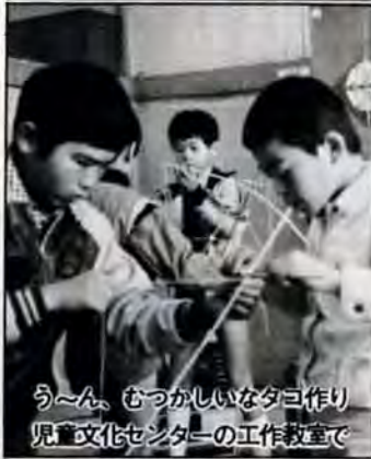
う〜ん、むつかしいなタコ作り 児童文化センターの工作教室で