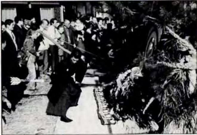
お尻ふりふり、豊作祈願ーいつ見てもユーモラスなこのお祭りは、1月8日、小倉南区井手浦で行われた「尻ふりまつり」です。鯉川さんが、今年の豊作を願って「ふり、二ふり」。観客たちは大喜びでした。