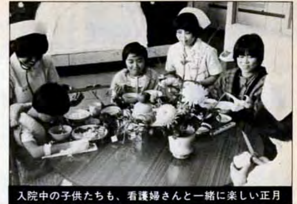
入院中の子供たちも、看護婦さんと一緒に楽しい正月