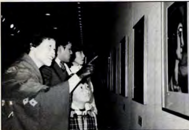
ぼくの版画とは違うわねー1月6日から開館した美術館の「ルオー版画展」。木版画を想像する子ピッ子に「これは銅版画と言ってね…版画を酸につけると…」と説明に汗だくのお母さん。2月1日まで開催。

すぐ北側に的場池体育館があります。そして体育館を中心とした的場池公園の整備が進められています。多目的広場(ゲートボールやバレーボール等ができます)、テニスコート・プール・レストハウスなどが完成間近です。