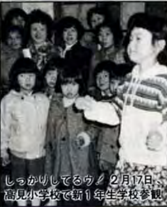
しっかりしてるウ！ 2月17日、高見小学校で新1年生学校参観

無料相談 行政相談—3月5日・19日午前10時～午後3時、八幡東区役所相談室で。 巡回交通事故相談—3月6日・13日・20日午前10時～午後4時、八幡東区役所相談室で。 年金相談—3月10日午前10時～午後4時、八幡東区役所相談室で。 心配ごと相談—毎週水曜・金曜日午前10時～午後3時、八幡東区社会福祉センター(八幡東区役所裏)で。第4金曜日は弁護士が面談。 法律人権特別相談—3月10日午前10時～午後3時、八幡東区役所大会議室で。 買物苦情相談—3月16日午後1時～4時、八幡東区役所相談室で。