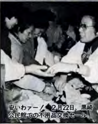
安いカー／ 2月22日、黒崎公民館での不用品交換セ－ル。