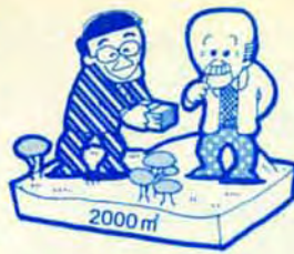
一定面積以上の土地取引には契約する前に届出が必要です

す。契約の6週間前に届出て審査に適合してから履行してください。また、初めは規定の面積以下の