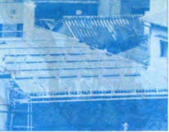
小倉北区の公衆浴場に太陽熱利用施設設置補助を行いました

私たちの暮らしは、家庭生活のみならず、社会全体としても、エネルギーのおかげで、たいへん便利で豊かになっています。そしてこうした傾向は、今後さらに続くものと予測されています。それは先進諸外国と比較して、生活関連面（これを民生部門といいます）でのエネルギー消費は、まだ低位にあるからです。しかし、省エネルギーの必要性が訴えられている今日、ほんとうの豊かさとは何であるかについても、もう一度考えてみる必要があると思います。