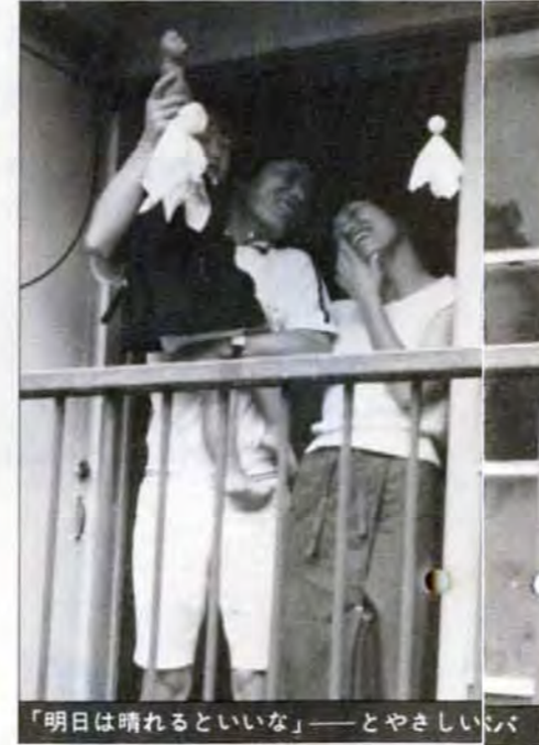
「明日は晴れるといいな」——とやさしい言葉