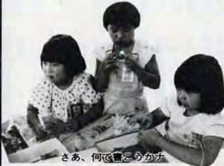
さあ、何で書こうかな