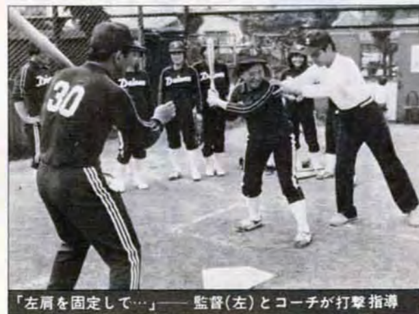
「左肩を固定して…」——監督(左)とコーチが打撃指導