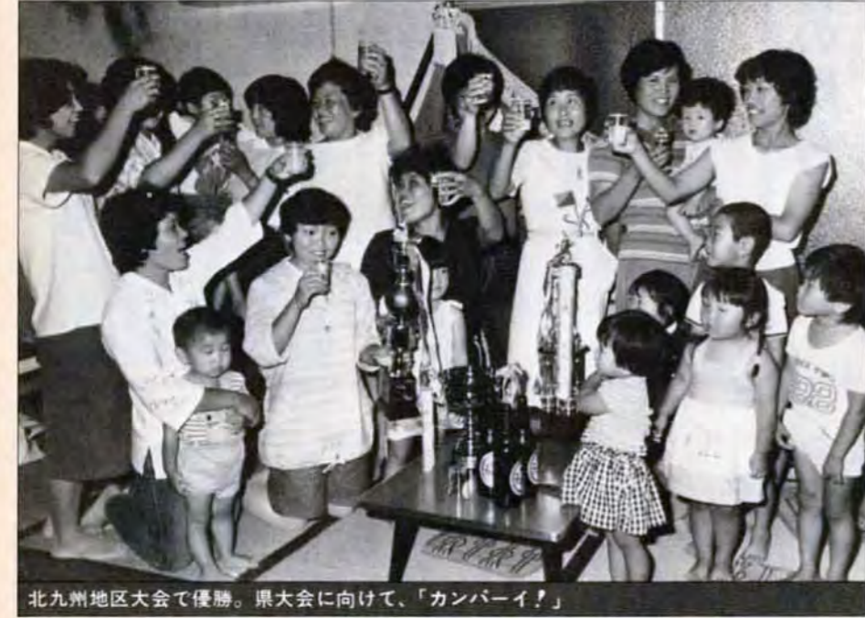
北九州地区大会で優勝。県大会に向けて、「カンパイ!」