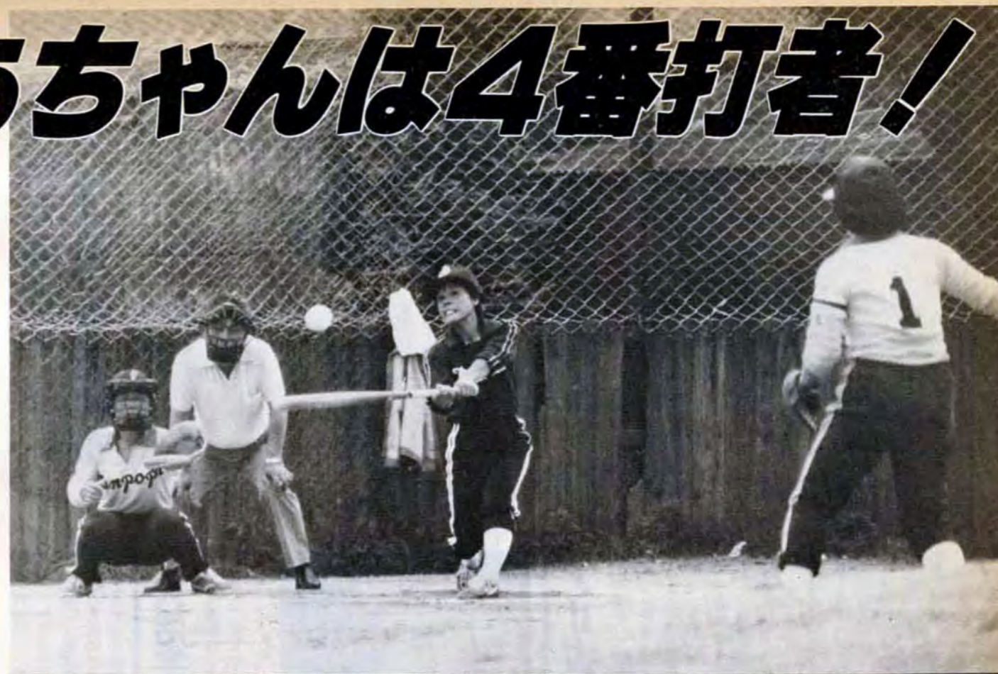
1死2塁、3塁——試合を決める快打が炸裂! 大南クラブお得意の連打攻勢。審判はもちろん、選手のお父ちゃん