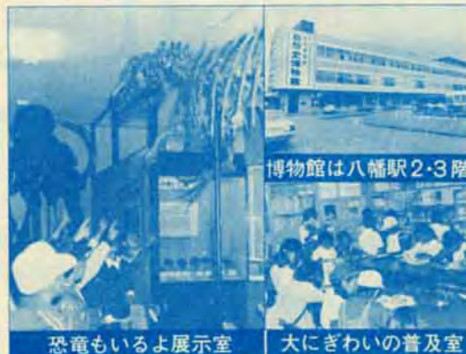
恐竜もいるよ展示室