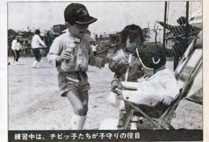
練習中は、チビっ子たちが子守りの役目