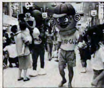
アニメの人気者も登場