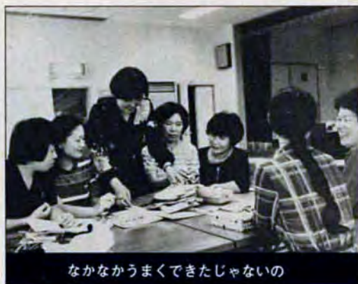
なかなかうまくできたじゃないの

受講希望者が百人もつめかけ、結局クシ引きで二十五人が幸運を射止めたという人気講座。なかには、クシにもれた友達から「あなた、しっかり勉強