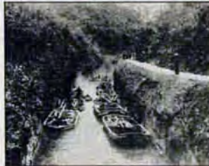
大正5年、堀川と川橋