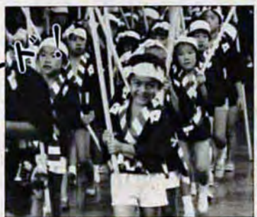
かわいいな。子供奴