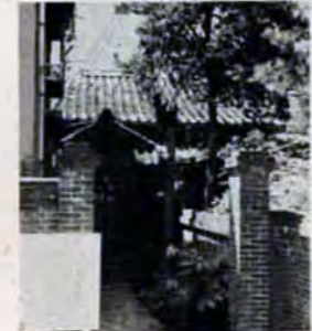
森鷗外旧居を復元

しいので今回の復元となったものです。総事業費は約一千六百万円で、来年3月末には復元され、その後は市民のみなさんに公開する予定です。