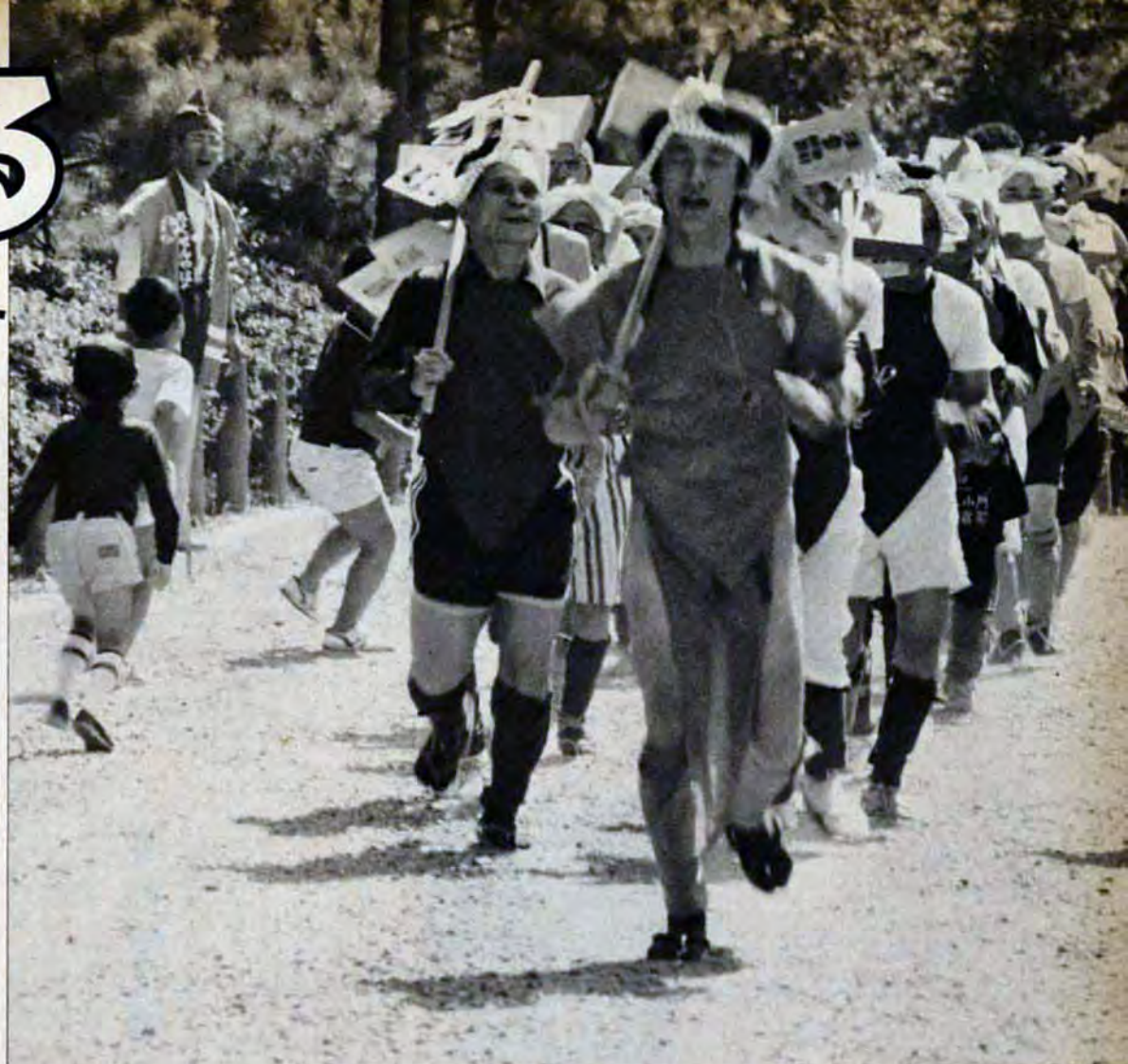
先頭は全コース歩き、走った案内役さん…初めてしめた六尺ふんどしでお尻が日焼けしたそうだ