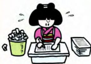
作文づくり奮戦記

〈賞〉 入選23点に3000円の図書券を進呈。入選や選外の通知は本人あてにします。