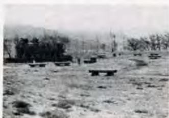
整地されて生まれかわった城山公園

たんです。私の家は、山手にあるもんで、小学校の五年生になるころまでは、電気も水道もついとりませんでした。しかし、ここからの眺めは最高ですよ。なんせ、黒崎が一望できるんですから。火事が出たときなんかは、火の出たところが手にとるようになりました。