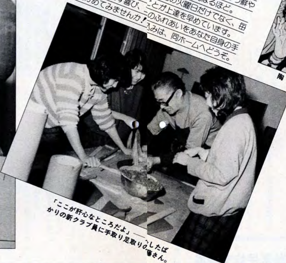
「ここが肝心なところだよ」——作ったばかりの新クラブ員に手取り足取りの指導を。