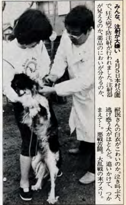
みんな、注射が大嫌い。4月5日日本村公園で、狂犬病予防注射が行われました。注射器が見えるのが、薬品のおいが分かるのか、吠えだす。悪戦苦闘。大乱戦の末ブスリ。

性で編成されたチーム。 【日程】5月13日午前9時〜午後3時、浅生球場。 出場申込みは、5月7日までに戸畑中央公民館(浅生)〒131-7、882局4281へ。 また同時に、昭和59年度レク・バレエチームの登録も受け付けます。登録をしないと試合に参加できません。必ず登録して下さい。 ★対象は、生後3か月〜18生ワクチン か月の市民で、これまでに3回服用していない人。すでに18か月を過ぎた人は戸畑保健所871局4527へ相談を。服用は無料。 【服用できない人】熱がある、下痢をしている、けいれん性体質、アレルギー体質、ひどく心臓・腎臓・肝臓等が悪い、はしか・BCG等の予防接種をして一か月たっていない人など。 【注意事項】必ずお子さんの体温を測り、健康状態のわかる保護者が付き添うこと。母子健康手帳と印章をお忘れなく。 【日程】いずれも午後1時30分〜2時45分。▼4月20日大谷公民館 ▼24日天籟寺公民館 ▼25日山東公民館 ▼26日二枝公民館 (以上全日程)