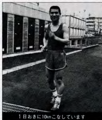
1日おきに10kmこなしています