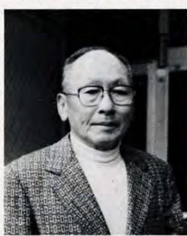
いま、城野二町内自治会長・北方校区自治連合会副会長として活躍しています。

例えば、町内の一人暮らしのお年寄りにはよく訪問して声をかけ、あまり訪問して相手が恐縮するよ