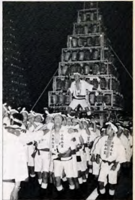
7月14日の戸畑祇園大山笠競演会で