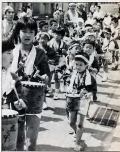
響く！五平太ばやし

7月21日、中川町から本町へねり歩いてきたチビッ子たち。昼間は五平太ばやし。夜は火まつりにも参加するという。送られる声援はひときわ大きい。