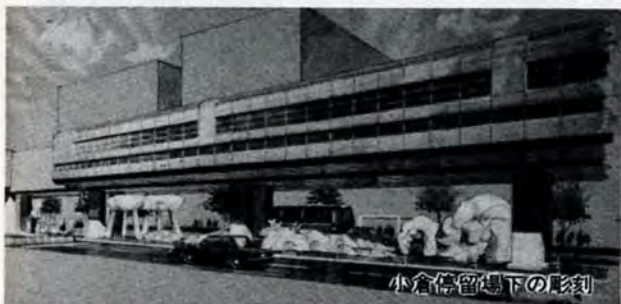
小倉停留場下の彫刻

都市モノレール小倉線の全線試験運転が始まりました。これと並行して周辺環境の整備が進んでいます。 国鉄小倉駅前本市の玄関口です。モノレール完成後は、一般利用客や観光客が増えることが予想されます。そこで、モノレール停留場下の空間に彫刻や噴水、植栽等を施し、両側の歩道を周辺と連携させて整備し、通行者の目を楽しませ、心をなごませる景観づくりを行う予定です。12月初旬に完成します。総工費一億六百万円。