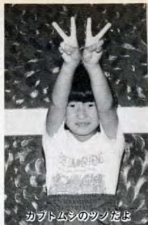
カブトムシのツンたよ

「あのね。お父さんがカブトムシを三匹くれたの。でも、すぐに死んじゃった。それで、どうしたらうまく育てられるかっていろいろ工夫してみたの。」