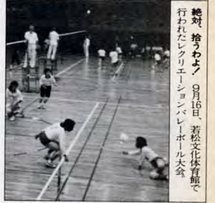
絶対、拾うわよ。9月16日、若松文化体育館で行われたレクリエーションバレーボール大会