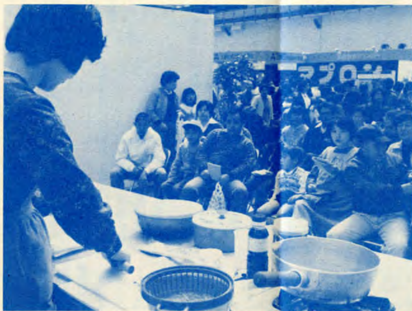
前回好評だった料理教室

私たちにとって、「健康」こそ最も大切なもの。そして、その「健康」は、「食生活」と切っても切れない関係にあります。そこで、第七回を迎えるフードウィーク北九州展では、「食生活」と「健康」について、皆さんといっしょに考えてみたいと思います。この機会に家庭の食生活を再点検してみたいか、ができればいいです。家族そろって「やっせ」。