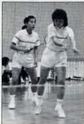
それノ サープだノ 9月16日夜宮青少年センターで行われたバドミントン大会。約百人が心地よい汗を流した。