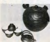
常滑焼壺巻物急須・金彩茶器セット(愛知県)

歴史とロマンの中ではなく、手づくりの工芸品。東海・甲斐・信州地方の優れた伝統工芸品と郷土玩具を展示・即売します。家族そろってどうぞ。 【日程】 10月13日～11月19日午前9時～午後6時(11月中は午後5時まで)、九州民芸資料館(小倉北区城内2-11、小倉城内)で。小倉城入場料、大人百円、中学・高校生七十円、小学生以下三十円が必要です。 出品は、山梨・長野・静岡・愛知・岐阜・三重の六県から、伝統工芸品二百九十点、郷土玩具六十五点を展示。 問合せは、市経済局商工観光課82局2053へ。