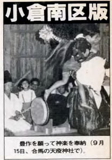
豊作を願って神楽を奉納(9月15日、合馬の天疫神社で)。