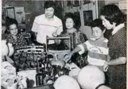
よくできてるネー—お年寄りの力作が勢ぞろい。9月11日~16日、社会福祉センターの3年長者作品展。で。

事や飲み物をとらずにどうぞ。申込みは、10月1日~11日に八幡東保健所0990へ電話でどうぞ。先着順受付。 【日程】10月12日午前9時~10時15分(三十人)・10時45分~11時45分(二十人)・午後1時~2時30分(三十五人)、八幡東保健所。★対象は、被爆者健康手帳か同健康診断受診書証を持つ人(受診日に必ず持参)。無料。 【日程】10月4日・5日・8日午前9時~11時八幡東保健所。★対象は、常時家庭にいる主婦。お年寄り、商店の従事者など。無料。内容はエックス線間接撮影。器具、ボタンのない肌着など。★対象は、35歳以上の妊婦。妊婦は受診できません。検診料は、35歳以下39歳以下1600円、40歳以下64歳以下500円。ただし、65歳以上の人、生活保護世帯の人、59年度市民税非課税世帯の人は無料。当日は食