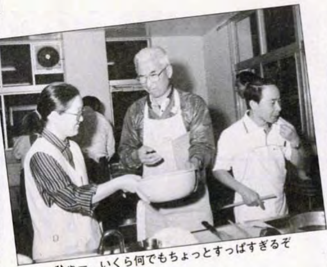
ひゃー、いくら何でもちょっとずばすぎるぞ