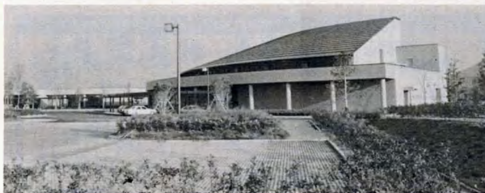
●西部斎場—八幡西区洞北町2番地の4 (奥洞海緑地に隣接)

11月15日から、若松区の小田山火葬場、八幡西区の本城・香月火葬場を廃止して、「西部斎場」を開設します。 これは、昭和56年4月に開設した東部斎場に続くもので、老朽化した旧火葬場(藍島火葬場を除く)を東西二か所に整理統合。緑をふんだんに取り入れたオープンスペースに、さん新で明るい近代的デザインを採用。公害のない最新設備を備えた大型斎場としました。 この西部斎場は、若松区、八幡東・西区、戸畑区の皆さんに利用していただくこととなります。