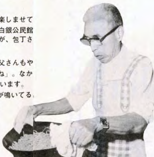
アッチッチ！——熱さと大格闘

「こんなに料理が面白いもとはねえ。女性だけに楽しませてく手はないですよ」——毎週金曜日の夜、小倉北区の白銀公民館開かれていた「男性料理教室」。25人の名(?)コックが、包丁さきも鮮やかに、自慢の腕を振っています。