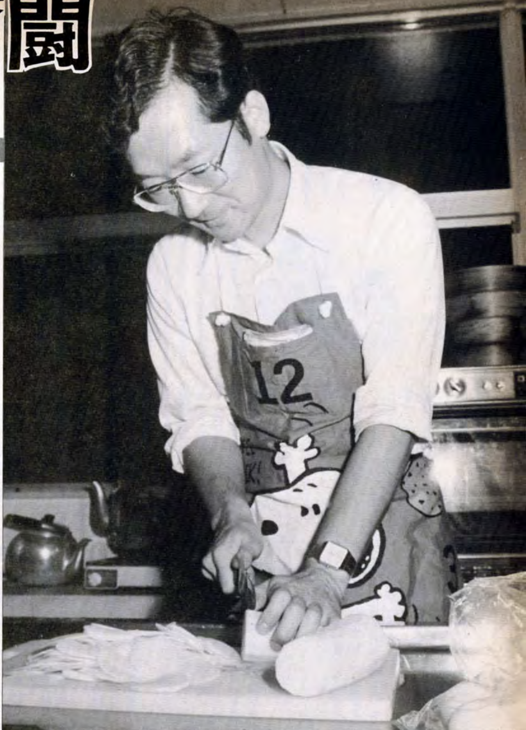
トントン・ト・ト・ト——見事な包丁さばきはプロ顔負け?

「この料理酒、そのままぐっーとやりたいね」「腹の虫が鳴いてる、早くできんかなあ」。わいわいがやがや——1時間余りの苦闘の末、出来上がった瓦そばならぬ白銀そば。「自作の料理の味はまた格別」と舌鼓を打っていました。