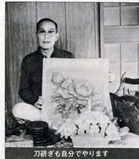
刀研ぎも自分でやります

とき/11月19日午後2時〜4時 ところ/畑公民館(大字畑905-1) 問合せ先・門司区役所市民相談室331局0039