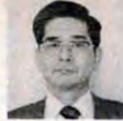
長三 区長 小倉南 太田

対象は区民。応募は無料。自作未発表のものに限ります。賞は市長賞など。 応募は、11月30日までに小倉南中央公民館(☎02若園五丁目1-5、91局4220)へ。