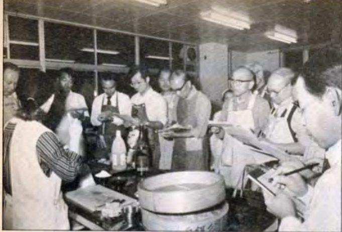
「ふうん、なるほど」。料理の秘けつを克明にメモ