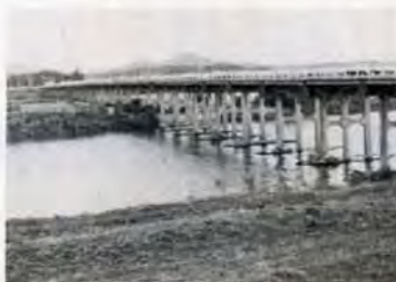
昔は橋もなく 渡し船が行き来しよった

な若者がつま先立って浅瀬を走って行く。シャーンと網を投げる。魚はそれこそ一網打尽。子供心にそこがとったよ。 屋間はよう泳ぎよった。釣りもしよった。いちようの木におるケムシの腹ワタを酢につけて糸にする。二層位しか取れんのやが、これをテグス(釣糸)にする。面白いくとも釣れよった。夕方になると川下から白い帆を立てて石炭船が帰ってくる。七輪の煙をなびかせて、歌を歌いながら、のんびりと帰ってくる。 わしらは、「ごはんぞ」と家のもんが呼びに来るまで遊びよった。 木屋瀬は、長崎街道の宿場町として有名やが、わしにとっては大川で過ごしたこまごまのころと忘れられんね。