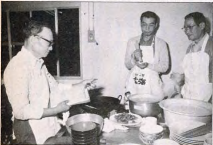
「あと30秒煮ること...か」真剣な目でメモや時計とにらめっこ