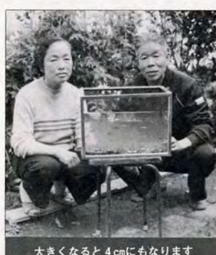
大きくなると4cmにもなります

「水槽に入れてたら、冬を越してもまだ生きてたんです。これなら飼育できるかなって思っ始めたんです」と奥さん。普段は、熱帯魚のえさなどを与えているが、パンくずなどで十分。水温も気にせず済むので手間がかからない。四、五年生きて、四センチにもなった大きなメダカもいる。「でも、生まれてすぐのころは気をつけています。いっしょ