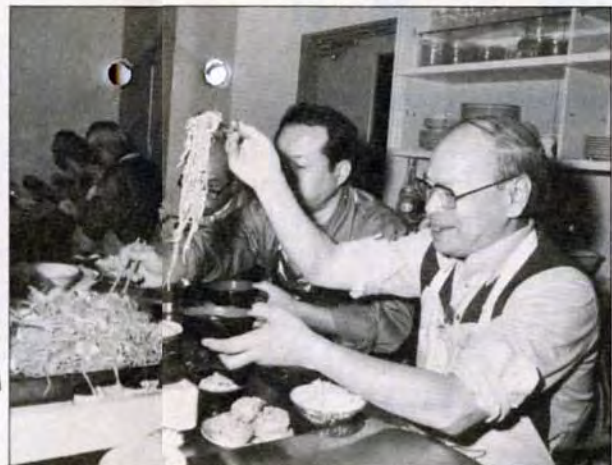
こりゃあ、なかなかいける——作って知ったこのうまさ