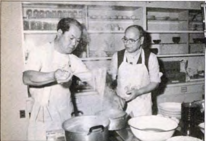
おととと、慎重に。やけどはコックの恥