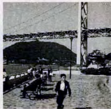
ノーフォーク広場開園(10/7)