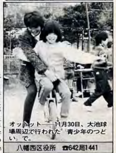
オットットー 11月30日、大池球場周辺で行われた「青少年のつどい」で。 八幡西区役所 ☎642局1441