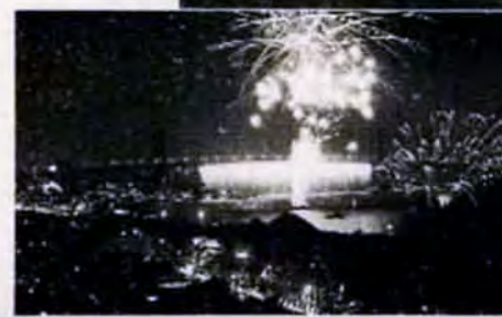
ブルーインパルスも参加。第1回海の祭典(7/20～7/22)