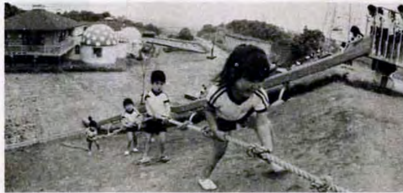
ヨイショ、ヨイショ、楽しいな。第2緑地保育センター*もりのいえ、オープン(4/11)