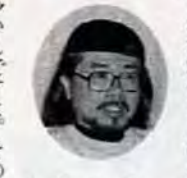
小学生・高校生に北九州で

来年2月8日は、北九州市長選挙・北九州市議会議員補欠選挙(門司区選挙区)です(馬島・藍島は2月6日)。身体障害のため、投票所へ行くことが困難な人で、次の基準に当てはまる人は、自宅で投票用紙に記入(自筆のこと)し、郵送で投票することができます。 ▼身体障害者手帳を持っている人で、①両下肢・体幹・移動機能の障害が一級か二級の人、②心臓・腎臓・直腸・ぼうこう・呼吸器の障害が一級か二級の人。 ▼戦傷病者手帳を持っている人で、①両下肢・体 幹の障害が特別項症(第二項症の人)②心臓・腎臓・呼吸器の障害が特別項症(第三項症の人)など、この投票をする人は、あらかじめ住所地の区選挙管理委員会(各区役所内)に申し出て、郵便投票証明書の交付を受けなければなりません。郵便投票証明書の有効期限は、交付を受けた日から四年間です。 新たに郵便投票証明書の交付を受ける人、すでに交付を受けているが更新の必要のある人は、早めに手続きを済ませて下さい。 問合せは、各区選挙管理委員会へ。