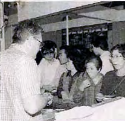
各国の食品・ギフト用品がずらり。'86西日本国際見本市(10/9～10/21)