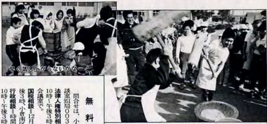
早く蒸し上がらないかなー

気持ちを入れて、ヨイショ！ 12月4日、東朽網小学校で行われた“もちつき大会”。