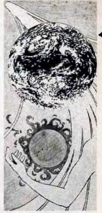
生命の海からくる知識や情報を手(生徒)が受けとっている——松本零士さんの作品

市は、生徒数の増加が著しい志徳中学校から分離・新設する守恒中学校を、小倉南区葉山町三丁目に建設中です。 二万七千六百平方メートルの敷地に、四階建て延べ五千四百五十平方メートルの校舎棟と、二階建て延べ千六百三十九平方メートルの屋内運動場棟を建設。工費は約八億六千万円。 同校は来年春に開校予定で、「ゆとりと文化性を持った校舎」「生活の場としての学校」を基本テーマとしてデザインした中庭は、スチールをデザイン化した中庭は、ステージを設け、文化祭や各種の発表会に利用できる多目的広場に。