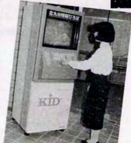
キャプテンシステム始動(3/31)