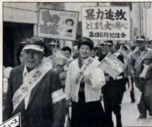
なくせ、暴力！—12月3日、若松市民会館で「若松区暴力追放区民総決起大会」が行われました。タスキ姿に小旗、プラカードを持った区民約800人が参加して、商店街をパレード。暴力追放の機運が盛り上がりました。

※月曜・祝日・月末・12月28日～1月3日は休館。12月27日まで特別貸し出し。1人6冊まで。★読書会—1月8日午前10時～正午。