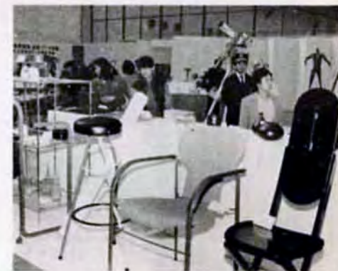
新感覚!北九州デザインフェスティバル(11/17～11/24)