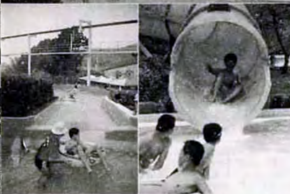
思う存分水しぶき! アドベンチャープールオープン(7/5)