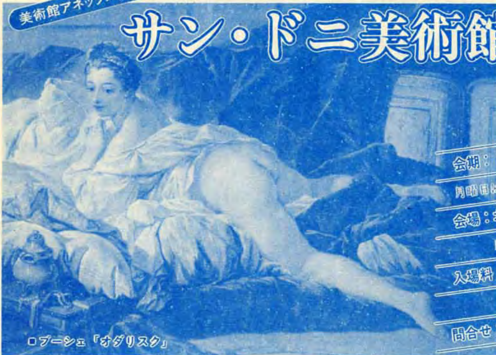
ロブ=シユ「オダリスク」