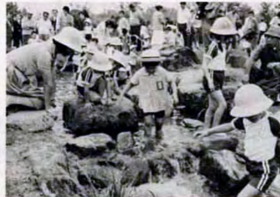
水とふれあう緑の広場。城内せせらぎ広場完成(7/4)