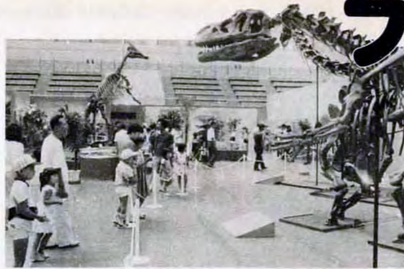
巨大な恐竜にびっくり。中国の動物と恐竜の世界展(8/10～8/24)