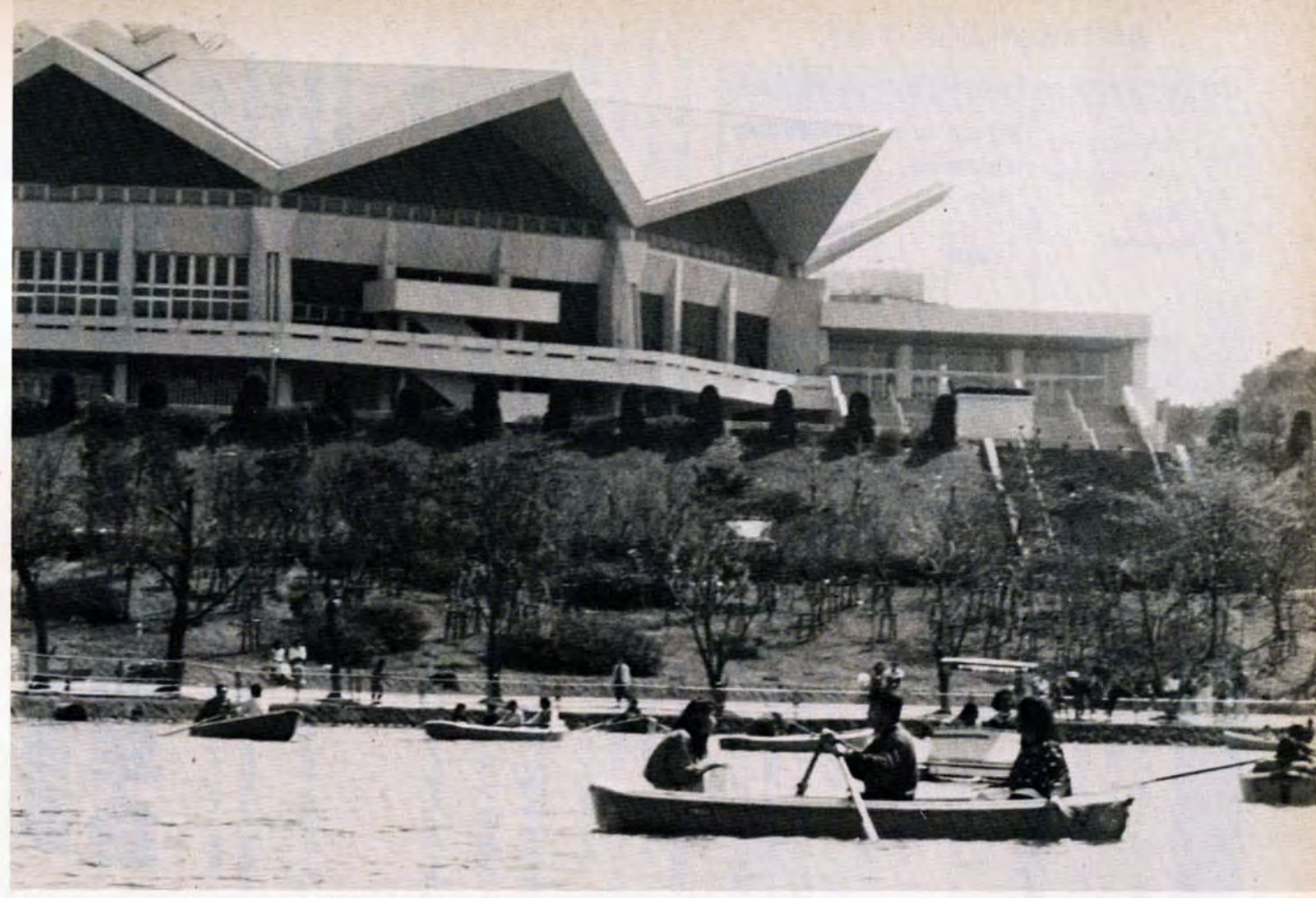
行楽客でにぎわう金比羅池と総合体育館

私たちも、お弁当を食べた後、展望台にさよして、今後は総合体育館の裏手にある福祉公園に行ったの。こ、目や体の不自由な人のために作られた公園なんだけど、だれ利用できるんで、いつもチビっ子たちで大にぎわい。 この日は時間がなくて行けなかったけど、ちと足を延ばして美術館や美術の森を訪ねてみるのもロマンチックさーて、見所満載の中央公園周辺。ちょっぴれちゃったけど、だーい満足の日でした。