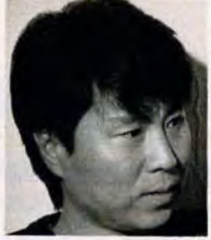
チョー・ヨンピル