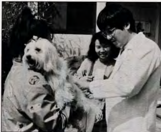
がまんだワン ☎4月4日、小石公民館での犬の登録と狂犬病予防注射。今年は、12日までに区内で約二千頭が登録を済ませました。

【5月】 ▶6日-①西畑市住 ⑨中畑日立社宅 ⑤畑保育所前 ▶7日-①今光公団 ⑤蟹住団地。 (以下次号)