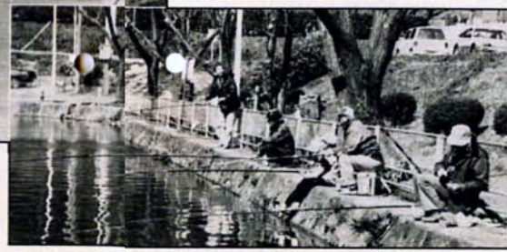
いったい何かるかな?(金比羅池)