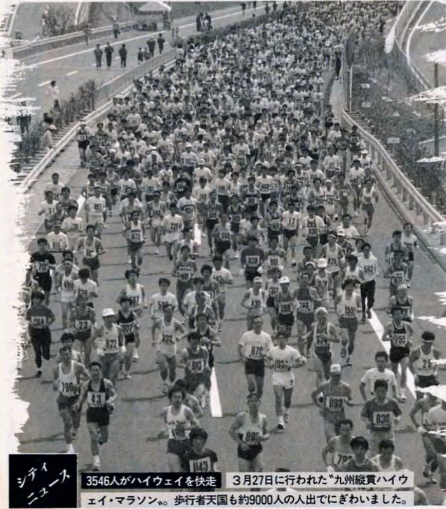
3546人がハイウェイを快走 3月27日に行われた九州縦貫ハイウェイ・マラソン。歩行者天国も約9000人の人出でにぎわいました。

661局 1584が尾倉公民館 ☎ 661局 0516へ。 ▼戸畑区 5月12日～12月8日の毎月第二・四水曜日午前10時～正午、戸畑中央公民館で、十五回、申し込みは、4月15日～30日に同館 ☎ 82局 4281へ。 ※八幡西区については、募集済みです。