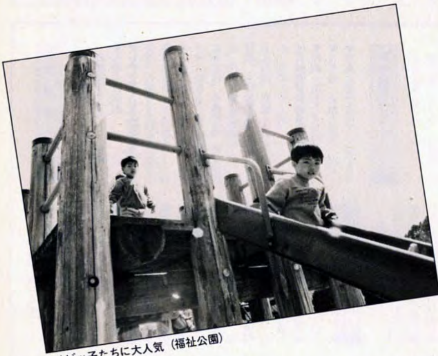
チビっ子たちに大人気(福祉公園)