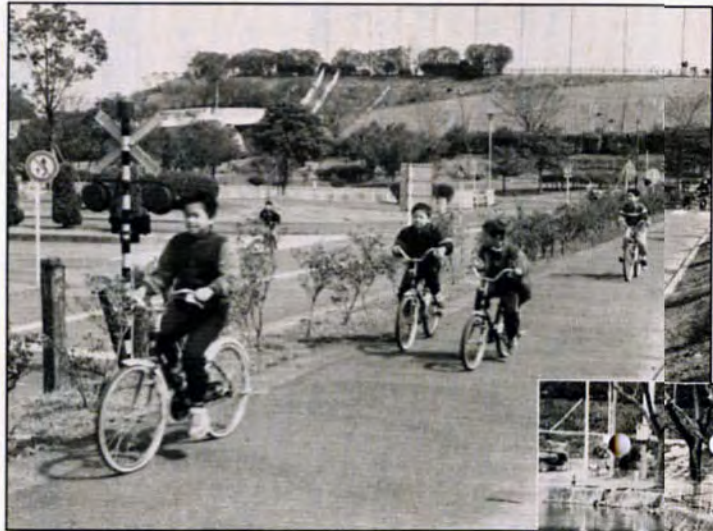
ルールを守って安全に(交通公園)