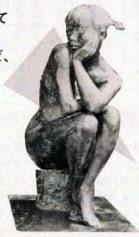
彫刻 コウ、 煌、 (美術の森公園内)