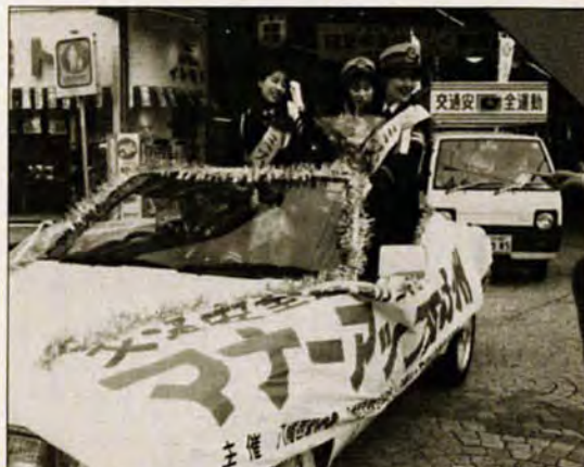
ミス黒崎もひとやく—4月6日～15日は、交通安全運動期間。八幡西区でも、これに先かけた4月5日、婦人警官姿のミス黒崎らによるキャンペーンが行われました。

申し込みは、4月23日までに、まつりWEST'88実行委員会562局6911へ(まつりについての問い合わせは、同実行委員会八幡西区役所振興課642局1441内線253へ)。