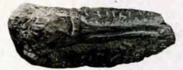
パンギンモドキの頭部化石

2月7日、八幡西区の丘陵で3000万年前の飛べない海鳥パンギンモドキ(プロトプテルム)の頭骨化石が発見されました。この化石は、完全な頭骨としては世界最初のもので、この謎の鳥の進化や生態の解明など、自然史を探るうえで貴重な発見となりました。(標本は下段の企画展で公開)