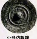
小形仿製鏡 など約四十点を展示。

鎮西上人坐像、黒田二十四騎画像、小倉織、小笠原氏資料、復元した民家、農具、漁具、和時計など 小倉北区内4-1 582局3196 5803 ※月曜日は休館 常設展 竪穴式住居の模型や縄文土器など北九州の先史時代、中世の考古資料千五百点を展示。マルチ・コーナー「高津尾遺跡の埋蔵文化財速報展」 5月8日まで。弥生時代の大落着・高津尾遺跡(小倉南区)から出土した(小児甕棺、小形仿製鏡、鉄器類、玉類など約四十点を展示。