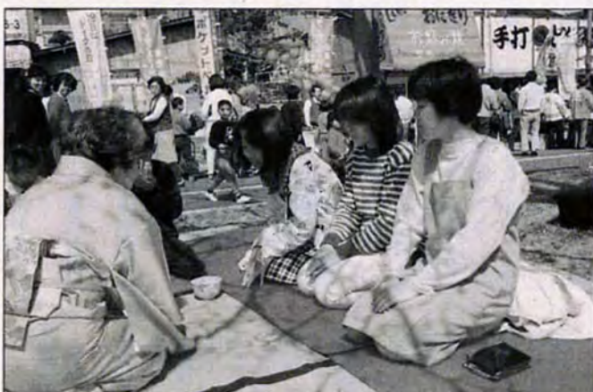
結構なお手前で 4月3日、さくら祭り(祇園一・二丁目)で。

★ おたのしみ会 = 4月23日午後 3時~4時。絵本の読み聞かせ や紙芝居等。