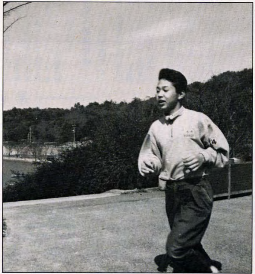
スイスイ、マイペースでジョギング (金比羅池トリムコース)