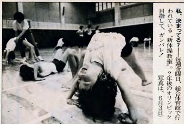
私、決まっている?—毎週金曜日、総合体育館で行われている「新体操教室」。7年後のオリンピックを目指して、ガンバレ! (写真は、6月3日)

問い合わせは、八幡東区役所市民相談室 ☎661局0039へ。 環境展＝6月30日まで。北九州の魚、河川環境保全などのパネルや模型等を展示します。