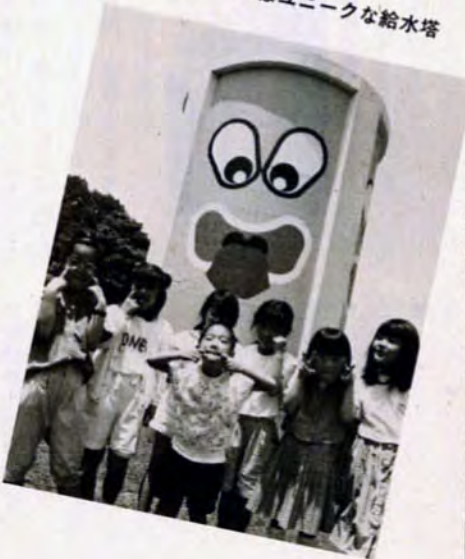
▼アッカペーはユニークな給水塔

企救丘での一日。とっても面白かった。お父さんは、ちょっと疲れきみだけど、夏休みになったら、友達みんな遊びに来るんだ。おねえちゃん、彼氏といっしょに来るんだって。ムリムリ。