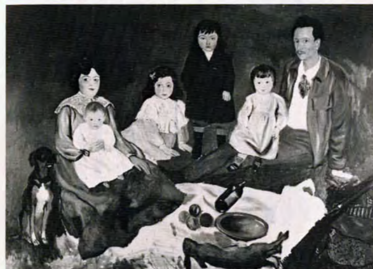
ピカソ作「ソレル家の人々」