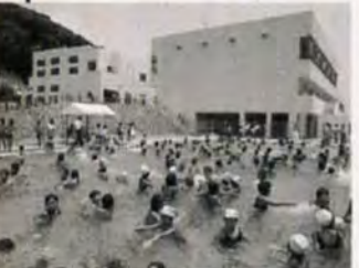
もじ少年自然の家

小倉北区下津四丁目3-12 ☎52局4152 ☎803 8月10日、祝日、月末は休館。入館無料。 オセロゲーム大会 6月26日午前10時～午後3時。対象は、小学生以上の人。小学生の部・中学生以上の部各先着四十人。参加無料。各部とも、三位までメダル・賞状・賞品を、四位に賞品を贈呈します。申し込みは、