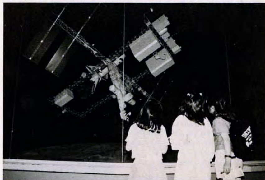
▼未来の宇宙へ夢が広がるスペースステーション