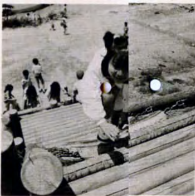
▼ヨイショとタイヤ登り