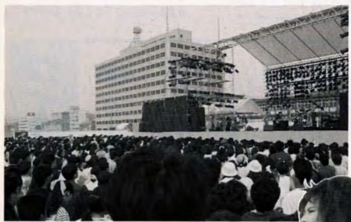
フアンを酔わせる熱演 熱狂する八千人の観衆

ビートが風にノッて来た! = 6月19日、門司区西海岸埋立地で行われた「門司港ロックウインド・コンサート BODY」。訪れた約8000人のファンは、体にしみる熱いビートに大熱狂。ポート門司は熱気に包まれていました。