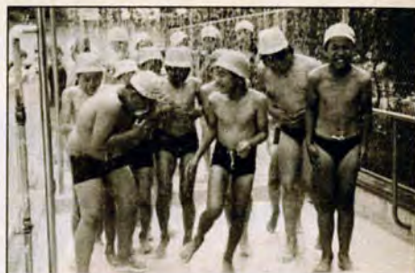
ウワー、冷たい——6月20日は、萩原小 学校のプール開き。待ちかねていた元気 っ子たちは、大はしゃぎ。水の冷たさも 何のその。すっかり夏気分でした。