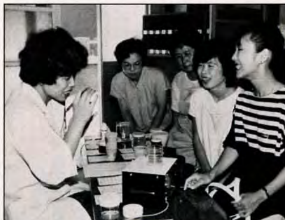
健康には塩加減がミシシ—6月21日、古前公民館で行われた健康料理教室の「みそ汁塩分濃度測定」。塩分の取り過ぎは健康の大敵です。「お宅は甘い方ね」の声に、「新婚ですもん」と、若奥さんはニコリ。

問い合わせは、若松区役所市民相談室 ☎761局0039へ。 中高年齢者雇用相談 ☎7月5日午前10時～午後3時、若松区役所第2会議室で。 交通事故相談 ☎7月13日午前10時～午後2時、石峰公民館で。