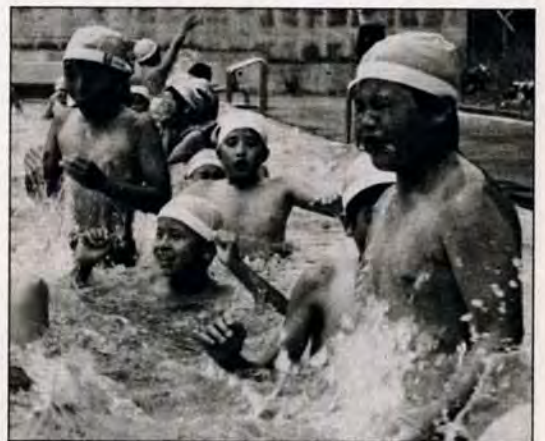
ワーツ 夏。—6月18日、寿山小学校では、プール開きが行われました。子どもたちは待ちに待ったプールにニコリ。「キャーツ」と水しぶきを上げ、大はしゃぎしていました。

問い合わせは、小倉北区役所市民相談室 ☎571局0039へ。 法律人権特別相談 ①1日午後1時30分～4時30分、小倉北区役所三階31会議室で。 年金相談 ①いずれも午前10時～午後4時 ②1日・8日・15日・22日・29日、小倉北区役所国保年金課前ホール ③7日・14日・21日・28日、市役所一階広聴課で。 行政相談 ①25日午前10時～午後3時