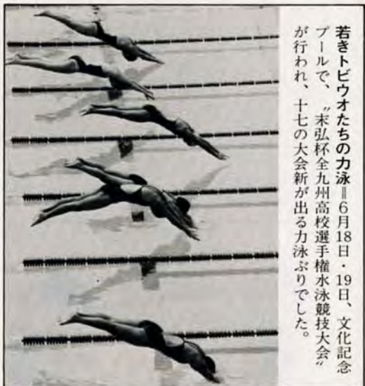
若きトビウオたちの力泳 6月18日・19日、文化記念プールで、末弘杯全九州高校選手権水泳競技大会が行われ、十七の大会新が出る力泳ぶりでした。

心配と相談 いずれも午前10時～午後3時。▼毎週火曜・木曜日 小倉南市民センター101配と