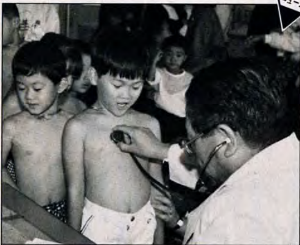
胸ドキドキしてるけど、病気じゃないよ！ = 11月2日、赤崎小学校では、就学時の健康診断、が行われました。みんな、初めての学校にちょっぴり緊張気味。でも、先生の「よし！」の言葉に思わずニコリ。