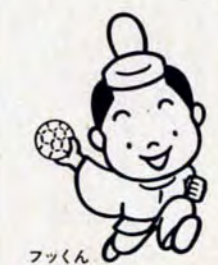
フックン 65年は、とびうめ国体、北九州でハンドボール競技があるんだよ。

11月20日正午～午後5時、総合体育館(八幡東区八王寺町)で。大学生以上千円、高校生五百円、小・中学生三百円。対戦カードは、「大崎電気」対「三陽商会」など。問い合わせは、教育委員会体育課(582局)2395へ。