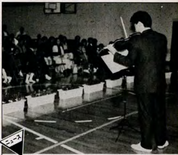
澄みきった音色にうっとり＝10月29日、新道寺小学校平尾分校体育館で行われた「平尾台コンサート」。独奏、音楽劇、合唱など盛りだくさんのプログラムに、聴衆は秋の一夜を満喫していました。

相談室 ▼25日 曾根農協 心配ごと相談 いずれも午前10時～午後3時。▼毎週火曜・木曜日 小倉南市民センター内心配ごと 相談室 ▼24日は法律相談日 毎週金曜日 小倉南区役所曾根出張所・両谷出張所。 年金相談 毎週金曜日の午前10時