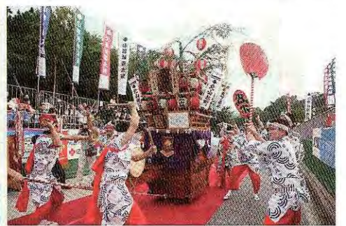
小倉祇園太鼓(7月18~20日)

問=問い合わせ 申=申し込み 料金について記載のない催しは入場無料(参加無料)。はがき・往復はがきの記入方法は7ページを参照。