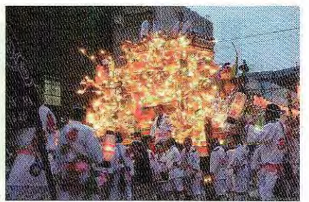
黒崎祇園 7月20日(日)~23日(水) 見どころは、八基の山笠が集結する23日の解散式です。

問=問い合わせ 申=申し込み 料金について記載のない催しは入場無料(参加無料)。はがき・往復はがきの記入方法は7ページを参照。