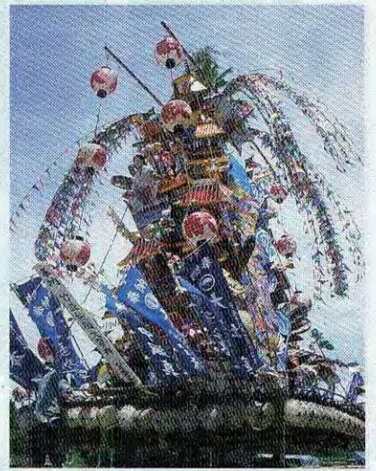
若松区の夏祭り(竹並祇園) 若松区の夏祭りのひとつ「竹並祇園」は、7月19日(土)と20日(日)に開催。