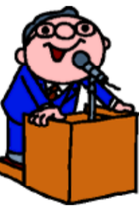
リポートク市民公開講座「あなたにもできる脳卒中の予防と介護」