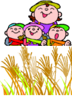
平尾台自然の郷の催し

①アートのフェスティバル 10月1日(日)11月29日(火)10月10日以外の月曜日と10月11日は休館の9時～17時。入場無料。②ススキ観察ハイキング 10月9日(日)9時30分、平尾台自然観察センターに集合。15時、同所で解散。抽選30人。参加無料。③共通。①②③は必要。往復はがき（何人でも）に希望催し名と全員の住所・氏名・年齢・電話番号を書いて10月3日までに同センター☎803・0180（小倉南区平尾台一丁目4・40）☎453・3737へ。