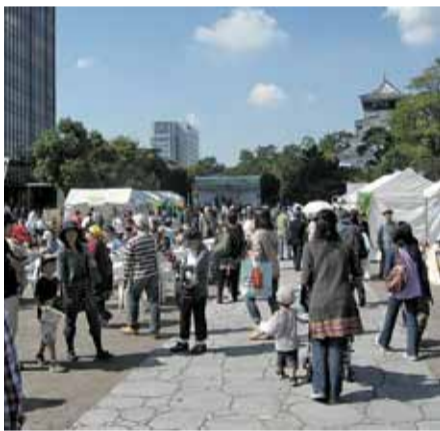
▲楽しくエコを学べる催しが盛りだくさん

エコライフステージは「エコライフ」について考え、提案する西日本最大級の環境イベントです。環境活動を行うNPOや企業、学校、行政など