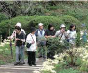
▲説明を聞きながら観察します