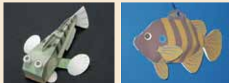
▲トビハゼ(左)とオヤニラミを作ってみよう