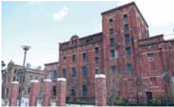
▲青空に煉瓦の赤が映える大里赤煉瓦タウン

大里こたわり食市。市内産こだわり食材の直売やスティーブメントなど。旧サッポロビール醸造棟の一般公開。赤煉瓦造りの醸造棟を説明を聞きながら見学します。 ※ 11月27日(日)10～15時、大里赤煉瓦タウン(門司駅北側)で。荒天中止。☎門司区役所総務企画課 ☎331・1881内線262)へ。