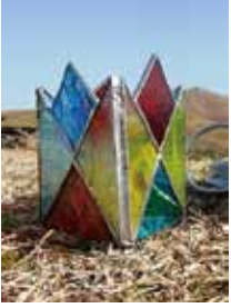
▲手作りしたステンドグラスの輝きは格別!

ハープ教室「花と木の美のナチュラリス作り」 12月9日(日)10時30分～14時。☎先着16人。☎1800円。 スタンダードクラス教室 キーホルダーやキャンドルカバを作ります。12月18日(日)14時(各2時間)。☎先着各回5人。☎700円～5200円。