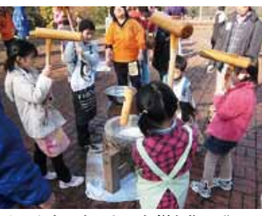
▲みんなでおいしいお餅を作るぞ!

生花を使って作ります。12月20日(火)18時30分〜20時30分。北九州パレス(小倉北区井堀五丁目)で。先着30人。参加費4000円(35歳