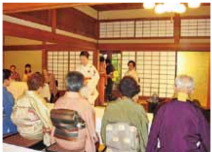
▲昨年の茶会の様子