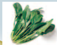
【ほうレンソウ】甘みが強く、ビタミンなどの栄養がたっぷり詰まっています。

編集 小倉南区役所総務企画課 ☎951・4111 (代表) FAX 951・5553