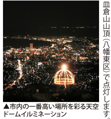
▲市内の一番高い場所を彩る天空ドームイルミネーション

の8時45分～12時、13～17時30分。▶※不動産トラブルなどの宅建相談▶12月3～24日の毎週火曜日13時30分～17時▶※マンション管理に関する相談▶12月4日(水)・18日(水)の13時30分～15時30分▶※住まいの安全・耐震相談▶12月6～27日の毎週金曜日13時30分～17時▶※住宅法律相談▶12月12日(水)・26日(水)の13時30分～16時▶※福岡県建築住宅センター▶住宅相談コーナー(小倉北区古船場町)商工貿易会館1階▶533・5443▶※は事前に▶が必要。 ▶共通▶1は事前に▶が必要。▶詳細は帆柱ケーブル▶671・4761へ。 ▶夜間営業など▶12月24日(火)・25日(水)は、ケーブルカーの下り最終便の発車を22時まで延長し、無料シャトルバス(八幡駅～帆柱ケーブル山麓駅)を運行します。▶時間は▶を。 ▶押し花額作り「クリスマスキャンドル編」▶12月8日(日)13時30分～15時。▶水環境館(小倉北区船場町)で。▶小学生以上。▶先着15人。▶350円。▶12月3日から同施設▶51・3011へ。