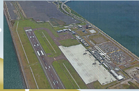
【北九州空港】韓国へ新たに釜山線とソウル線が就航します。