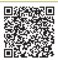
登録サイトのQRコード

は、市のホームページ(アドレスは表紙参照)でもご覧になれます。 問 環境局環境監視課 ☎582・2200へ。