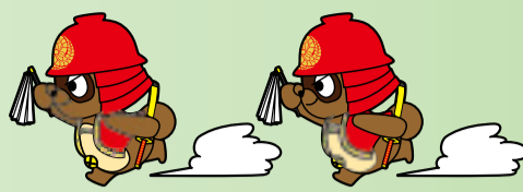
八幡西区マスコットキャラクター官兵衛タン