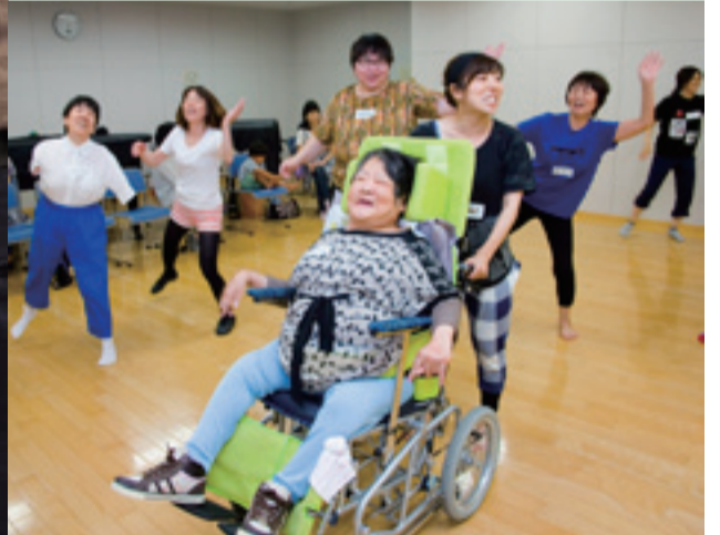
みんなで一緒に楽しくダンス