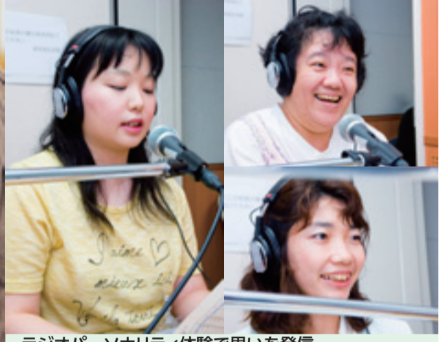
ラジオパーソナリティ体験で思いを発信