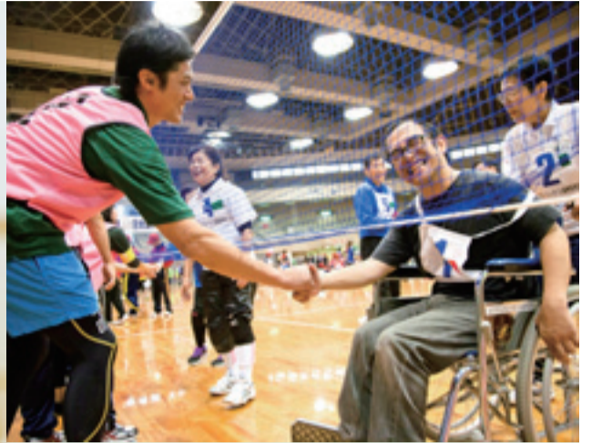
ふうせんバレーボール大会で熱戦後の握手